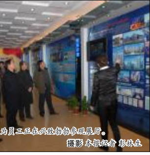
图为员工正在兴致勃勃地参观展厅。

在展厅工作人员的细致讲解中，广大员工从企业发展理念、团队建设、产业现状、广阔前景以及领导关怀和诚信合作等方面详细了解了山西铝厂整