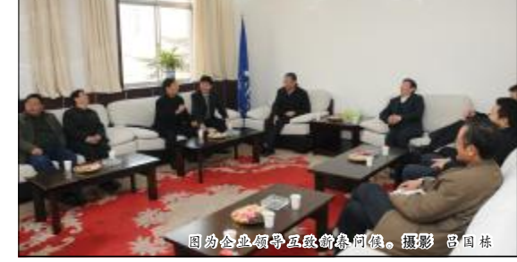
图为铝基地四家企业互致新春问候。