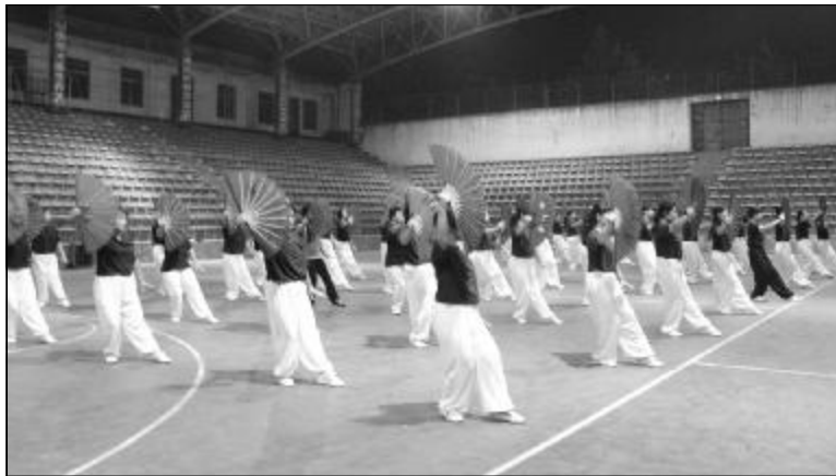
8月5日晚8点,由厂工会组织,技术开发部和部分体育爱好者共50余人表演的节目《太极功夫扇》在灯光球场进行了最后一次彩排。8月8日,他们将代表中铝山西企业参加天津市“首个全民健身日”节目汇演。图为彩排现场。摄影报道 马飞月

本报讯 为引导干部群众深刻理解爱国主义的丰富内涵,切实实践科学发展观要求,近日科技化工公司党总支组织全体员工利用中心组学习、党员政治学习时间,通过报刊、网络等形式集中学习了“100位为新中国成立做出突出贡献的英雄模范人物和100位新中国成立以来感动中国人物”候选人先进事迹并积极参与投票活动。怀着对英雄模范人物的敬仰之情,大家郑重投出了自己的选票,表示要学习先进人物的崇高精神,并转化为工作动力,不断提高自身素质和工作能力。(蔡会良)