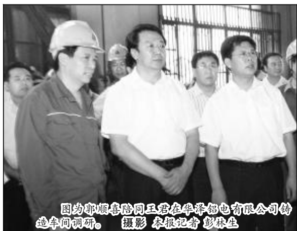
图为郭顺喜陪同王君在华泽铝电有限公司铸造车间调研。

厂区,王君了解了生产工艺及建设情况,听取了马达卡对中国铝业山西分公司基本情况及下一步打算的汇报。2008年四季度以来,山西分公司积极应对金融危机,以深入学习实践科学发展观为契机,坚持开源节流的经营方针,组织全员投入到控亏增盈攻坚战,采取了一系列非常举措,成本逐步下降,控亏增盈攻坚战取得了阶段性胜利,保持了企业和谐稳定的良好局面,目前正在做进一步复产的准备工作。王君对山西分公司积极应对金融危机所采取的措施,取得的成效给予了肯定。同时,王君还比较关心企业的发展,关切地询问了山西分公司氧化铝厂的建设、生产工艺及技术创新等情况。看到山西分公司近几年的生产经营情况后,他鼓励道,一定要坚定信心,鼓足干劲,渡过难关,实现企业新的发展。