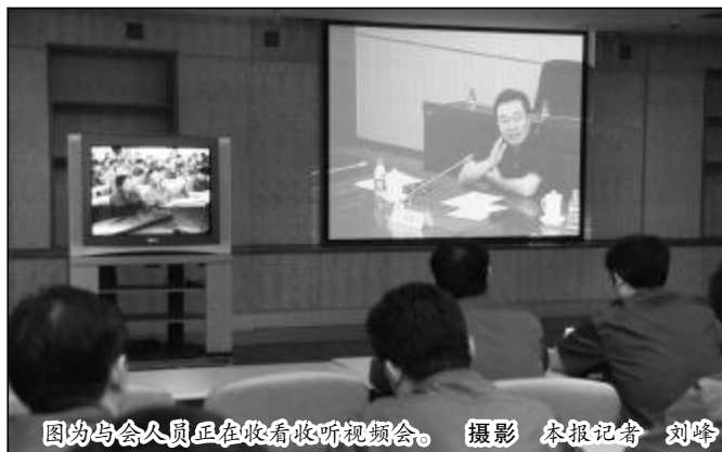
图为与会人员正在收看收听视频会。

依然存在,所以必须进一步统一思想,提高认识,不能有任何的盲目乐观和丝毫的松懈怠慢,必须全力以赴做好控亏增盈各项工作。对于下半年工作,罗建川强调,各分子公司要将控亏和利润指标层层分解,将压力层层传递到位,实现公司整体扭亏为盈的总体目标。他要求各分子公司,一要继续坚持“一保二压三从紧”的政策,深挖内潜,确保实现全年任务目标;二要加强市场研究和市场运作,果断决策,积极应对,力求实效,坚决反对“光说不练”和“马后炮”,加强市场操作风险控制;三要加快矿山建设,优化供矿结构,提高供矿能力;四要进一步解放思想,转变观念,向先进民营企业对标学习,真正落实熊维平总经理提出的“更加解放思想,更加实事求是,更加改革创新”的要求,转变“民营企业优点学不了”和“国有企业习惯改不了”的两种观念;五要做好安全稳定工作,落实“从严抓管理,铁腕治安全”,确保公司生产经营的安全稳定。