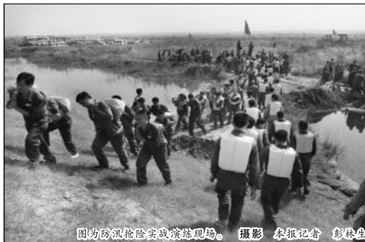
图为防汛抢险实战演练现场。