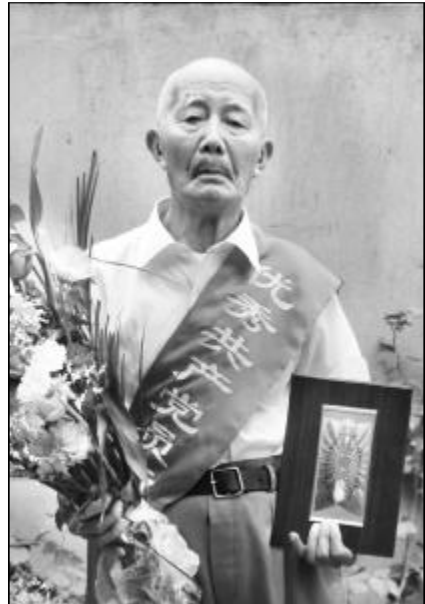
人,却揣有一颗火热的心,扶危济困一掷千金,竭尽所能助困、助贫、助教育;就是一个极其节俭的人,在群众最需要的时候,一次又一次出手相助,用实际行动诠释着一名老共产党员的优良品质和高尚情操。

作为一位耄耋之年的老者,他总是忘记自己年事已高、疾病缠身,想方设法帮助他人。作为一名老共产党员,他始终坚持过组织生活,一刻都不放松对自己和家人的严格要求。就是这样一个生活极其简朴的