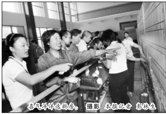
喜气洋洋选新房。