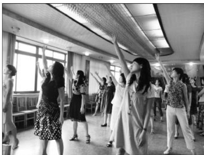
▲近日,技术开发部职工为参加中铝山西企业第四届职工艺术节活动进行了紧张的排练。图为排练现场。

热电厂化学车间开展“三读三促”读书活动 本报讯 近期,热电厂化学车间开展了“三读三促”读书活动。即,读学习实践科学发展观书籍,促进学习实践活动的深入开展;读安全操作规程类书籍,促进员工专业技能理论水平的提高;读《安全事故案例》,使员工加强安全防范意识,杜绝习惯性违章,促进自身综合素质的提高。通过活动的开展,丰富了员工的视野,增强了员工遵章守纪,反对“三违”的思想意识。(曹淑华)