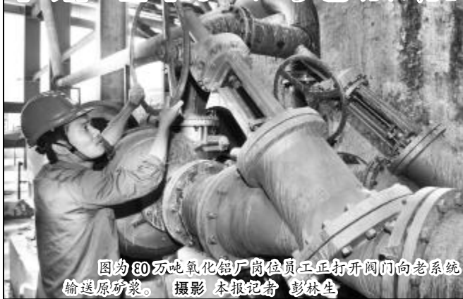
图:80万吨氧化铝厂岗位员工正打开阀门向老系统输送原矿浆。

中铝山西分公司“011”复产方案正式实施。经过20个小时的平稳运行,15日中午11时,氧化铝三分厂高压溶出I系列顺利出料,至此,老系统高水平复产按计划全面启动。