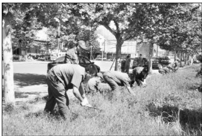
▲近日,东兴物业部太华区管委会组织“小红帽”义务劳动,对和谐街沿线绿化带内的杂草进行清除。“小红帽”顶烈日、冒酷暑,经过一上午的努力,草坪变成了“小平头”,绿化带面貌焕然一新,为居民夏季休闲纳凉创造了良好条件。图为“小红帽”为草坪认真“理发”。