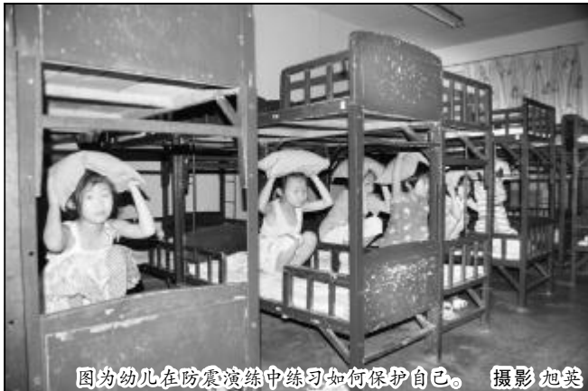
因为幼儿在防震演练中练习如何保护自己。

在深入开展学习实践科学发展观活动中,山西铝厂离退休管理服务中心家属委员会,以科学发展观为指导,本着以人为本,服务居民的思想,结合工作实际开展了“四门”活动,即:敲门、串门、心门、出门。