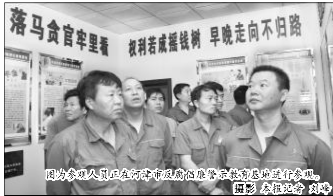
图为参观人员正在河津市反腐倡廉警示教育基地进行参观。