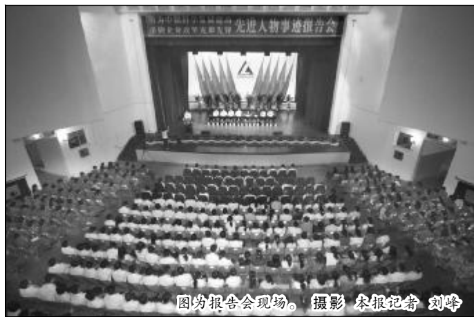
图为报告会现场。

本报讯(记者 吴建华)5月21日上午,山西铝厂影剧院内座无虚席,中铝公司“勇为中铝科学发展建功 争做企业攻坚克难先锋”先进人物事迹巡回报告会正在进行,先进人物的事迹引起与会人员深深的共鸣,大家以热烈的掌声表达了心中的感动和积极学习先进人物、誓为中铝公司建功立业、打赢控亏增盈攻坚战决心。来自中铝山西分公司、山西铝厂、山西华泽铝电有限公司和中色第十二冶金建设公司的4家企业领导班子和广大干部员工共1000余人聆听了事迹报告。报告会由中铝公司党群工作部副主任曹婉蓉主持。