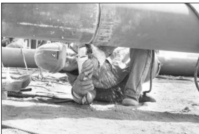
经过近50天的奋力拼搏,检修分厂圆满完成增加蒸汽联接管道任务,共新增钢梁300多吨、管道500余米,为分公司弹性生产奠定基础。图为检修员工在打磨焊接口。

在生活区施工,如果连续作业,容易影响到居民正常生活用电,若不连续作业,则影响工期。为了保证工作进度,尽可能不影响居民正常生活,每个工作小组合理安排人员和程序,白天装表,晚上加工第二天要用的互感器支架。工作中,他们不怕脏不怕累,安装支架、固定电表互感器、配线,遇到问题大家一起想办法,小组成员配合默契,工作有条不紊。经过10天艰苦奋战,维修中心顺利完成123块电表的安装任务。此项工程的完工,完善了变压器计量设施,有效地杜绝了能源流失、堵塞了收费漏洞,为东兴物业部实施公司制改革打下了坚实基础。(李朝明)