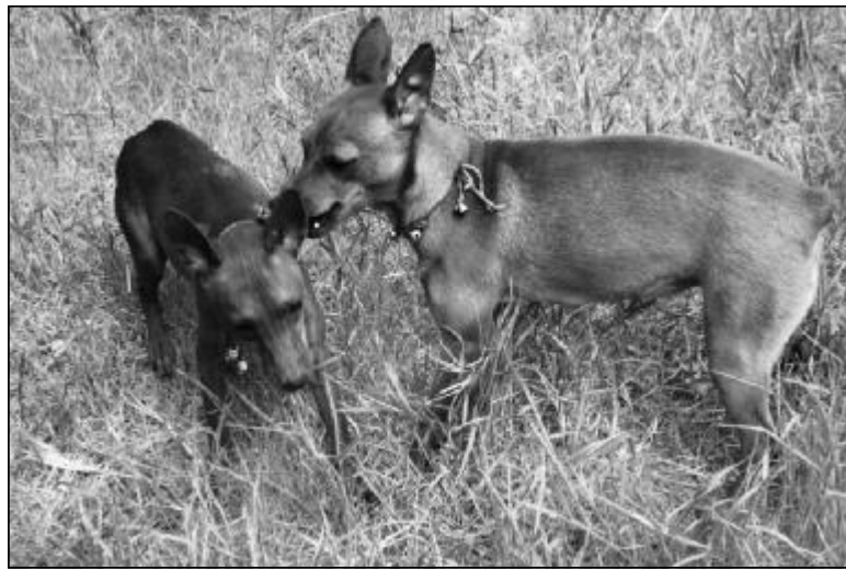
倾诉 摄影 王玉民

夜深人静的时候，皎洁的月光常常牵动思念之心，孤独之感。然而，当我打开书时，眼前便是一片五彩缤纷的世界，心中顿有一种遇到知音之感，随之令人心情豁然开朗，原先那种愁闷皆随风而去，感觉世界充满阳光，内心世界变得纯洁宁静，冲淡了思念之苦，赶走了寂寞，使我久浸在书香之中。