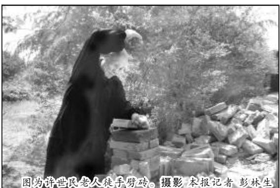
图为许世民老人徒手劈砖。

们不仅要做好本职工作,更应该多做一些有益于企业的事情,才能使我们的企业早日走出困境,实现科学发展,也使我们的幸福生活得到保障!