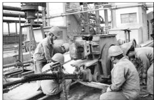
4月27日,氧化铝一分厂组织人员对一期翻车机系统消缺,通过更换车台钢丝绳、调整重车电器控制系统,使翻车机更加安全稳定地运行。图为检修人员正在更换重车牵引钢丝绳柱销。