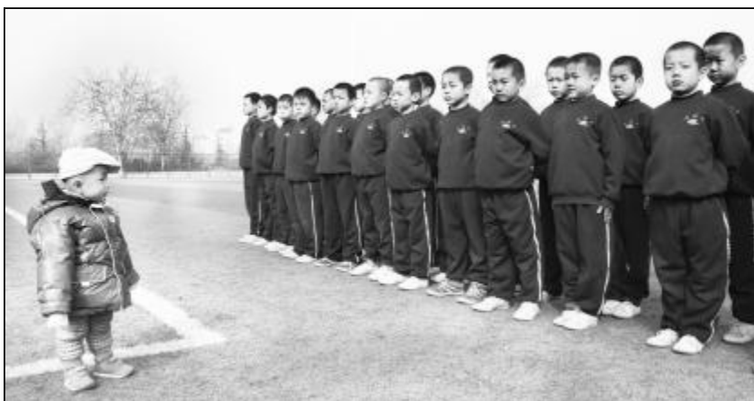
我的「团长」我的团