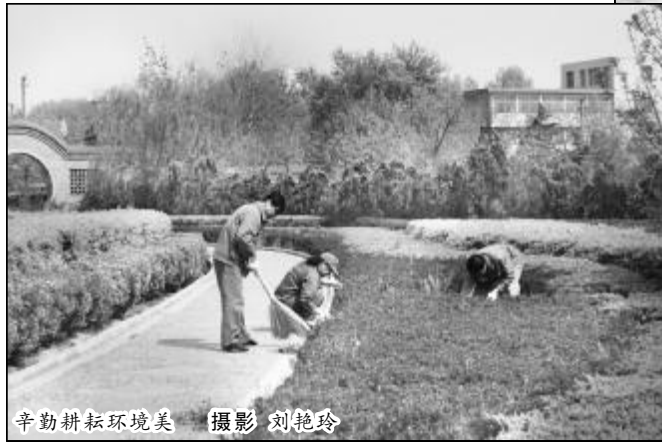
辛勤耕耘环境美