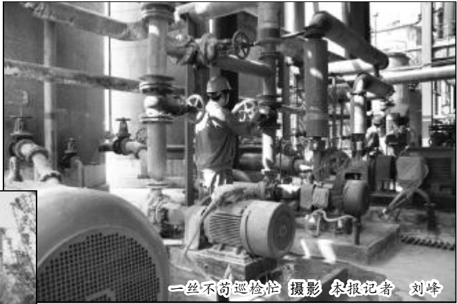
一丝不苟巡检忙