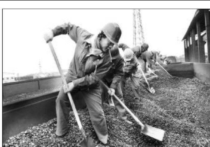
为打赢控亏增盈攻坚战,深入做好降耗挖潜工作,进一步锻炼队伍,提高员工战斗力,按照中铝山西分公司生产联席会要求,由生产运行部总体组织和统一安排部署,分公司各二级单位及机关部室全员参与的大宗原燃物料火车进厂人工卸车工作于3月11日全面展开。图为3月12日在运输部电煤站,技术开发部40余名员工进行煤炭物料人工清卸,共清理车皮7节,卸煤400余吨。摄影报道 柴玲 彭林生