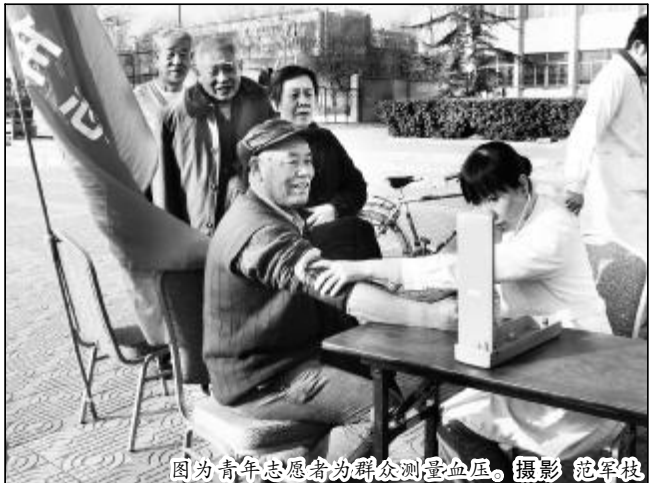
图为青年志愿者为群众测量血压。

行了修剪、浇水,晋铝建设有限公司团组织团员青年上团课,向团员青年传达中铝公司控亏增盈攻坚战会议精神,并提出合理化建议。 志愿之花开遍铝城的各个角落,为春天的铝城平添了几份生机与活力,更加坚定了广大青年坚决打赢控亏增盈攻坚战的决心。(杜亮芳)