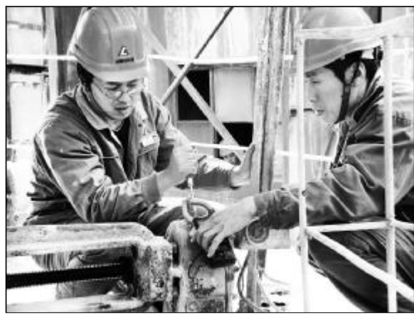
在当前弹性生产组织工作中,氧化铝四分厂坚持设备管理精细检修维护的原则,每天安排技术过硬人员对关键设备进行重点监测与维护,尽最大可能降低事故的发生,降低备品消耗量。图为检修人员正在悉心维护碳分槽电动机料阀。

视频会议结束后,郭顺喜就如何学习传达贯彻会议精神作了强调,要求各单位要组织班子成员认真学习讨论并将会议精神迅速传达到全体党员干部,确保取得实效。