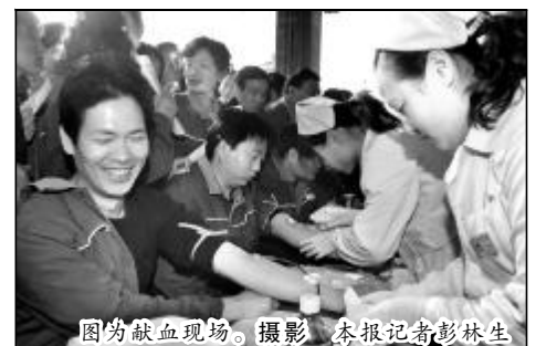
图为献血现场。

据悉,青年志愿者进入社区共发放“节能减排小知识”宣传单3千余份。350余名志愿者进行了义务献血。