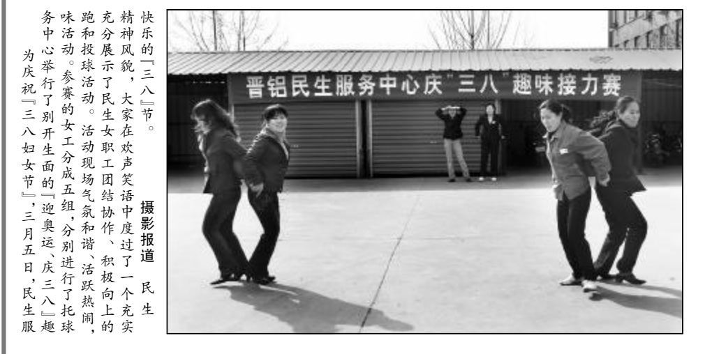
快乐的“三八”节。精神风貌,大家在欢声笑语中度过一个充实充分展示了民生女工团结协作、积极向上的跑和投球活动。活动现场气氛和谐、活跃热闹,味活动。参赛的女工分成五组,分别进行了托球、为庆祝“三八妇女节”,三月五日,民生服

本报讯 近日,热电分厂管道车间注重对新工进行技术培训,车间以一期收尘脱硫运行为契机,针对新工特点制定了详细的培训计划。在上岗前,首先让新工熟悉现场的安全注意事项及简单的生产工艺流程,针对操作中随时发现的问题,就系统基本原理及常见故障的分析、如何操作、处理等进行了实际操作培训,并强调了新工在操作中要做到安全第一,监护到位,多看多问,确保安全。通过培训,不仅提高了新工学习的积极性,更增强了安全防护意识,为下一步独立操作打下了坚实基础。(张雪敏)