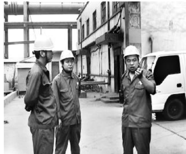
8月份,氧化铝一分厂积极贯彻中铝公司年中工作会议精神,在分厂深入开展“管理提升年”活动,分厂领导深入岗位进行调研,掌握第一手材料,为后五个月生产任务的完成创造条件。图为分厂领导在生产车间调研。

料浆、CO 2 气和压缩风的供应。加强设备管理。分厂以创建三星级设备分厂为目标,加强以点检为核心的设备管理,做好石灰炉、格子磨、原料磨等主机设备的大修工作,并在全体运行工中开展“设备维护员评定”活动,提高员工技术水平,提高设备的台时产能。加强安全生产和基础管理。分厂加强“严、细、实”管理理念的落实,严格事故责任制的落实,开展每周四查隐患活动,把事故消除在萌芽状态。加强技术管理。分厂对一车间1号皮带进行改造,供新老系统上料,有效提高翻车供料能力。对石灰炉卷扬系统进行自动化改造,减轻员工劳动强度。并以提高原矿浆60号细度、固含,生料浆碱比、钙比、石灰分解率,降低水份,稳定CO 2 浓度为重要任务,确保各项技术指标提高,消耗下降。加强党建工作和企业文化建设。融入中心工作,以深化“两保一促”活动和积极开展党建工作标准量化为契机,加强党员干部管理,加强作风建设,为企业发展提供精神动力和政治保证。同时,积极开展企业文化理念的学习,在员工中倡导敬业爱岗、忠于职守、创新创效、乐于奉献的企业文化氛围。(郭海斌)