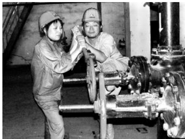
近期以来,空压站车间积极贯彻中铝公司年中工作会议精神,深入开展“节水减排”活动,倡导员工人人争当“节水减排”排头兵。图为岗位员工正在维护循环水阀门。

经过全体参战人员的努力,于15日下午提前12小时完成施工任务,并一次试车成功。通过分公司生产运行部的现场检查,氧化铝一分厂生料浆送料杜绝了边进边出的现象,实现了K、B两槽三泵向三车间大窑供料的目标,各项技术指标均达到合格。这次送料流程改造时间紧、任务重,广大参战人员超常规思维,连续作战,狠抓工作落实,提高了执行力和战斗力,受到了分公司领导的好评。