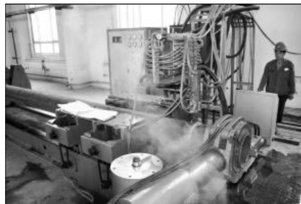
近日,检修分厂中频液压煨管机经过改装、调试后,正式投入生产运行。首批大直径煨管用于正在大修的热电2号锅炉。此中频液压煨管机煨管最大直径可达426毫米,改变了中铝山西企业大直径煨管要到外地加工的局面。图为检修员工正在精心操作中频液压煨管机。