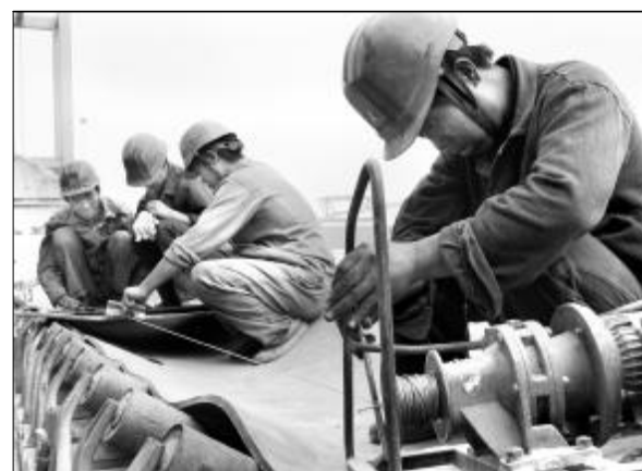
近日,为确保供料系统正常运行,80万吨氧化铝厂一车间对2号取料机主皮带进行更换,在点检站合理安排下,施工方保质量,抢工期,更换皮带总长351.5米,比计划提前一天完成了施工任务。图为施工方正对皮带进行交叉拔层。