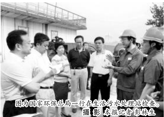
图为国家环保总局一行在污水处理站检查。

本报讯 8月17日,由国家环保总局环境监察局副处长任隆江、浙江绍兴市环境监察支队副队长李复根、国家环保总局环境工程评估中心工程师丁峰、山西省环境监察总队队长李义贤以及中央人民广播电台、《中国环境报》记者等组成的“流域限批”地区“回头看”检查组在运城市环保局局长谢爱玲、副局长常福运、河津市市长杨勤荣、常务副市长闫新民的陪同下来中铝山西分公司进行检查。中铝山西分公司总经理马达卡、副总经理薛亮民、张占明参加了检查。