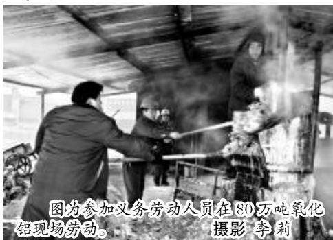
图为参加义务劳动人员在80万吨氧化铝现场劳动。

本报讯 为进一步加强管理,降低各项费用开支,强化广大员工自力更生、艰苦奋斗意识,中铝山西分公司组织相关单位进行了废料和结疤返生产流程义务劳动。