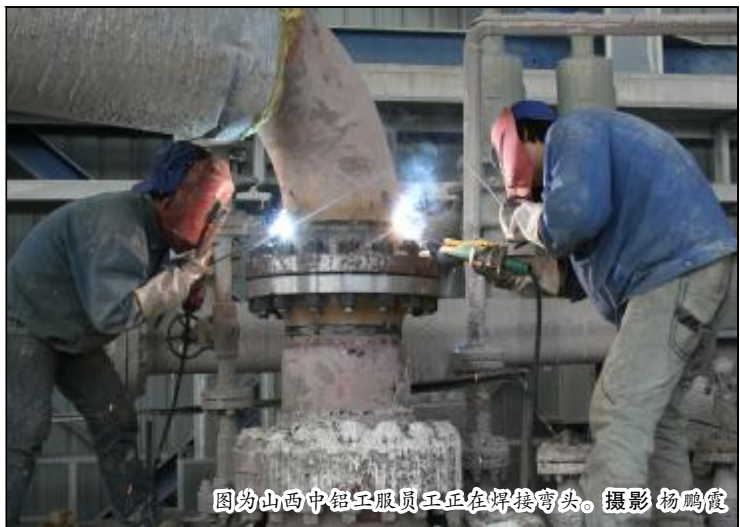
图为山西中铝工服员工正在焊接弯头。

自从山西分公司挖潜改造项目投产以来,生产单位和检修施工单位度过了适应磨合期,管道化溶出机组不论是运行状况、工艺指标,还是检修技巧都在稳步提高。压缩检修时间在各单位通力配合、默契协作下已成为必然结果。