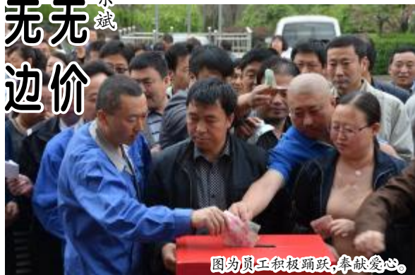
图为员工积极踊跃,奉献爱心。

“一方有难,八方支援”。在场捐款献爱心的有部分退休老干部、老员工、辖区片警、个体小商贩,还有家庭比较困难的员工家属,连小朋友也捐出了为数不多的零花钱,当然也不乏献爱心不留名的爱心人士。这次活动共募捐了约6.5万元,缓解了燃眉之急。