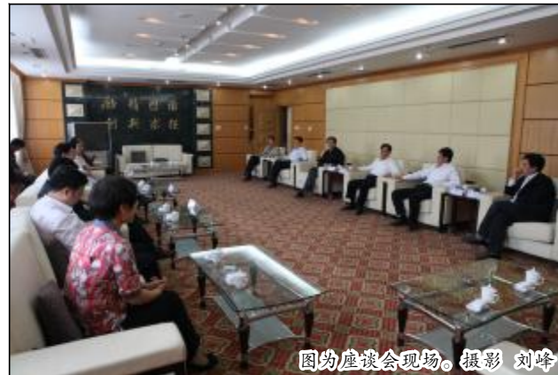
图为座谈会现场。

V 系列洗液管进行改造清理,缩短开车后下料时间;加强了对 V 系列管线整体的维护力度,使闪蒸器检修项目减少了 2 个,缩短了工期。装备能源部、生产运行部联系调度外围单位、控制生产指标,为停车检修创造有利条件。计控信息中心逐个对测温仪进行维护保养,确保自控仪表满足生产单位要求。通过各参战单位的密切配合,圆满完成了此次停车检修任务。(相关报道见本版)