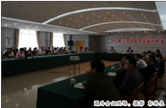
图为会议现场。摄影 彭林生

他强调,“四个一批”具体是指:培育一批,对于通过“主辅剥离”能够实现本质脱困的企业(或单位);盘活一批,对于“主辅剥离”出来的辅助资产,以及通过混