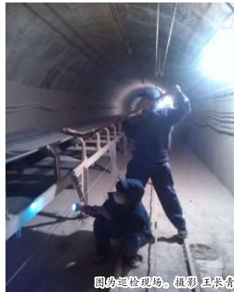
图为巡检现场。

“这条路是我们上下班的必经路,现在还好点,一到雨季,山体里渗出来的水和着地面上的粉尘,就会让这条路变得特别滑,每走一步都要小心”(下转第二版)