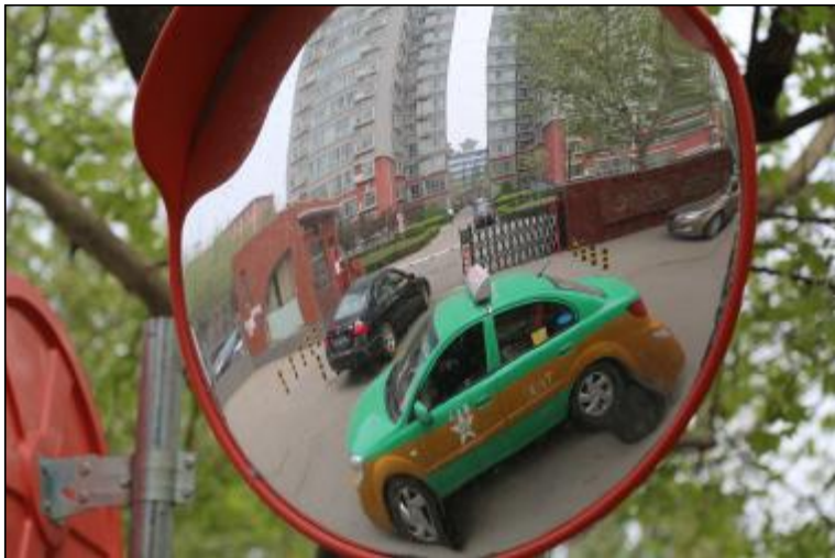
近日,生活服务中心在晋铝现代小区大门安装了一对凸透镜,保障上下班高峰期通行车辆及行人的安全。图为凸透镜里拍摄的车辆进出晋铝现代小区的情景。

此次培训为期15天,在经过专业培训后,培训中心将组织月嫂参加取证考试,获得月嫂的专业资质,也为参训人员踏入月嫂行业奠定良好的基础。(丁苗苗)