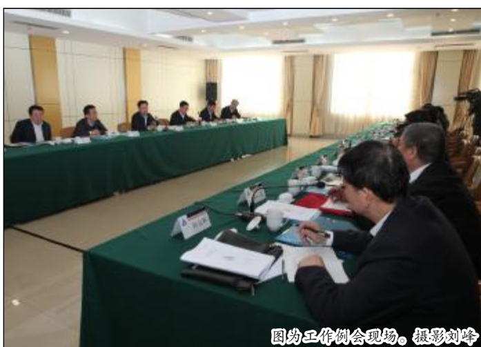
图为工作例会现场。

实践活动学习教育和征求意见,以及活动与中央、公司党组部署相结合,与企业本质脱困、转型升级相结合等情况。公司教育实践活动6个督导组组长分别汇报了前一阶段的工作情况、工作中存在的问题以及下一步工作重点。