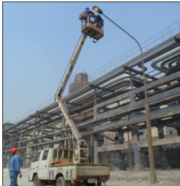
由于氧化铝老系统厂区路灯年久失修,所用备件型号已过时淘汰,不能维修,造成路灯多日不亮。3月26日,水电分厂一车间对厂区路灯进行更换,方便员工上下班。图为车间员工正在更换厂区路灯。

本报讯 近日,山西分公司财务部积极争取国家政策支持,实现精益税政管理,为山西分公司财务管理开源节流。在近两个月专项工作中,财务部与天津市地税局多次协调,与市地税局、铝厂所商谈,以2005年至2013年间的国家税总、财税等有关文件规定为依据据理说服,通过不懈努力,解决了“长期欠款清收效果不明显”的相关问题,节约成本91.49万元,为“清收陈欠”,实现本质脱困做出了积极贡献。(王婵明)