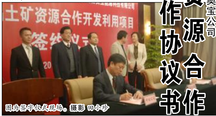
图为签约仪式现场。