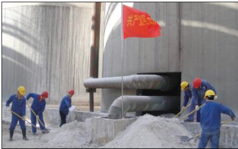
第二氧化铝厂分解车间党支部深入开展党的群众路线教育实践活动。3月20日,由15名党员组成的突击队对4号种分槽、1号循环泵周围积料进行清理,以实际行动践行党的群众路线教育实践活动。此次劳动,共清理积料3余吨,环境面貌明显得到了改变,也使员工日常操作更加便捷。

关知识。同时,分厂给每个党员配发一本笔记本,要求每一个党员通过动手做笔记,把党的群众路线教育实践活动应知应会200问学到实处,入脑入心。为检验学习效果,分厂还在全厂范围内组织开展了党的群众路线教育实践活动知识答题活动,进一步加深广大党员、干部对党的群众路线教育实践活动精神的学习理解,为下一步开展好教育实践活动打下坚实的基础。(冯云 吕红)