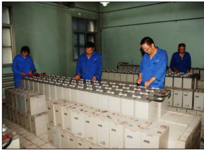
经过四天的连续工作,近日,热电分厂电气车间顺利完成老直流系统216块蓄电池更换工作,进一步提升了电气系统运行安全稳定系数。