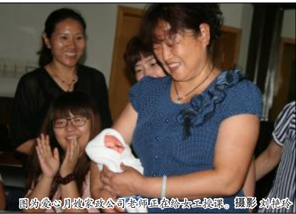
图为爱心月嫂家政公司老师正在给女工授课。摄影 刘艳玲

室内保洁、房屋信息咨询等业务，同时根据女工要求，将定期开办家庭菜培训班。（刘艳玲）