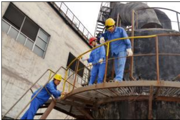
近日,热电厂锅炉车间党支部组织党员干部、利用双休日对 8 号锅炉粗粉分离器平台进行色彩化整治。自 8 号锅炉系统性检修后,锅炉车间,主动作为,承担了空气预热器清理疏通、炉本体漏风全面检查处理、炉底水密封槽疏通清理以及粗粉平台色彩化整治等 11 项工作,全面提升锅炉的技术性能,为 8 号锅炉检修后实现长周期安全经济运行奠定了基础。图为车间员工正在对楼梯扶手除锈、刷漆。