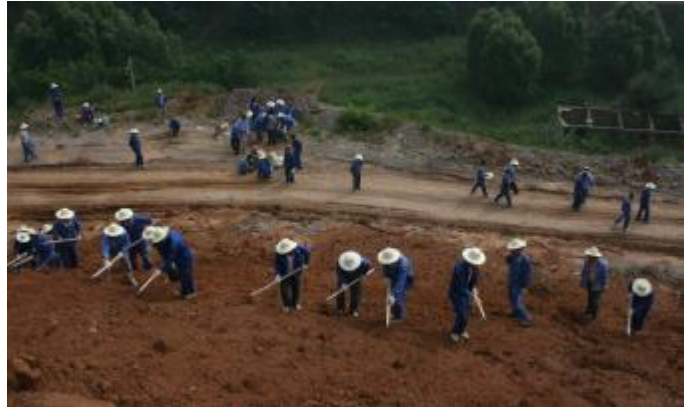
8月2日,孝义铝矿组织机关干部和车间员工 150 余人来到三期矿区相王采场,在采空区覆土造成田的倾斜边坡上种植苜蓿草种,用人工绿色植被加固边坡。