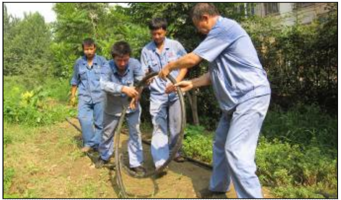
7月31日,朝霞北小区东侧门面房全部停电。故障就是命令,生活服务维修二车间组成党员抢修突击队赶赴现场,参加故障抢修,抢修人员挥汗如雨,冒着 35 度的高温,有条不紊地安装新电缆,经过 8 个小时的全力抢修,成功更换 200 余米的电缆,于当晚 22 时恢复正常供电。