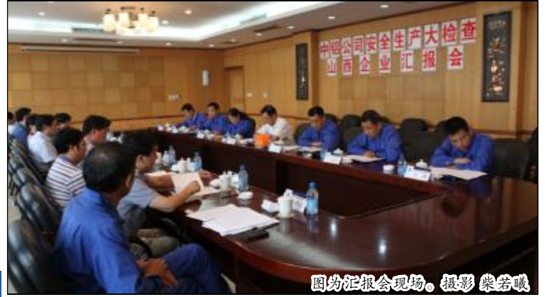
图为汇报会现场。