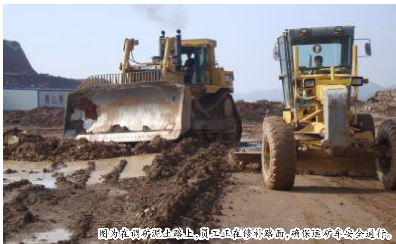
图为在调矿泥土路上，员工正在修补路面，确保运矿车安全通行。

近日，连续雨天，铝矿石湿度变大，为减少堵漏斗故障，孝义铝矿在二期、三期矿区同时增加筛矿工序：用挖机、装载机向网筛倾倒矿石，筛除容易粘结的矿粉，把筛出的矿块投进破碎系统，堵漏斗现象大为减少。同时，冒雨从距离二期矿区八公里的后务城采场调运已经采出储备的矿石，由于道路泥泞，孝义铝矿就调来数台松土机、平路机，守候在路边，每行驶过一辆拉矿车就迅速用土石填埋压出的带泥水的车辙，保证运矿石的车辆安全通过。