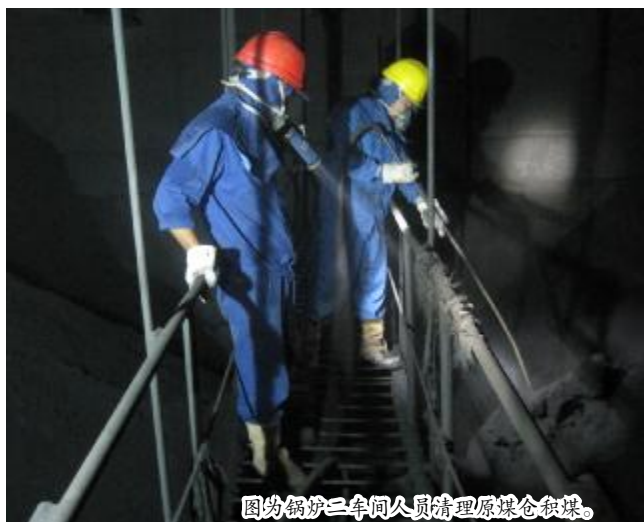
图为锅炉二车间人员清理原煤仓积煤。

紧张的抢修工作在他们钢铁般意志中、在他们全神贯注的工作中接近尾声，投运后的110KV种分变瓷瓶在明亮的灯光下折射出柔和的一道光圈，雨中的“嘶嘶啪啪”放电声已悄无声息，主变悠然地发出“嗡嗡”的正常的运行声音，雨中的抢修胜利结束。