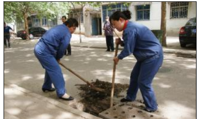
近日,生活服务中心各管委会相继开始清理各辖区内的雨排,为即将带来的汛期排水畅通提前做好准备。图为毓秀管委员会工在清理雨排。摄影报道 王中生