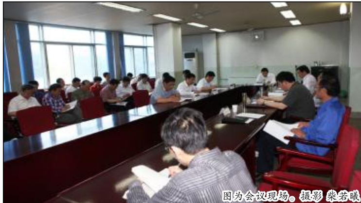
图为会议现场。