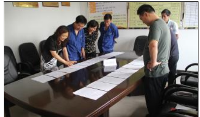
近日,矿业公司运行党支部开展学习十八大精神、运营转型知识和形势任务教育心得体会展评,并对心得体会内容进行了评比,把学习十八大精神、运营转型知识和形势任务教育引向深入。