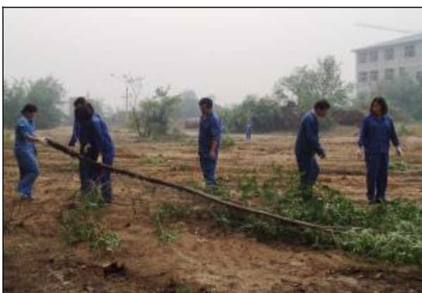
5月18日,营销中心组织党员骨干30余人利用周末时间对仓储三科南库库区杂草、野树进行清理。由于库区杂草和野树长得非常浓密,劳动人员使用铁锹、斧头、电锯、手工锯等工具,在机械车辆的配合下对库区门前、围墙边等重要部位进行清理,确保库区安全。