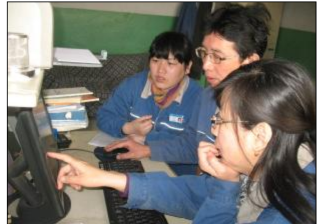
近日,山西电力系统组织开展进网电工资质复审工作,复审考核全部改为网上答题,每人在规定时间内有5次答题机会,考核不及格将取消电工作业资格。图为水电厂综合车间电工积极备战电力系统网上课程。

本报讯 第二氧化铝厂五车间针对Ⅲ步、Ⅳ步、Ⅴ步种分槽的设施增多的现状,改进管理模式,实行“讲、查、改、严”四字法提升安全管理,根据当天工作的实际情况,“讲”明安全注意事项以及防范措施;“查”安全隐患,对工作中存在的不安全因素和设备设施出现的隐患进行检查消除,做到心中有数,防患于未然;对习惯性违章行为和不规范操作现象的要及时整“改”;“严”格执行各项规章制度及操作规程,杜绝违章作业。“四字安全管理法”的推行,强化了员工的责任意识,提高了车间的安全管理水平,保证了生产的稳定运行。(黄静文)