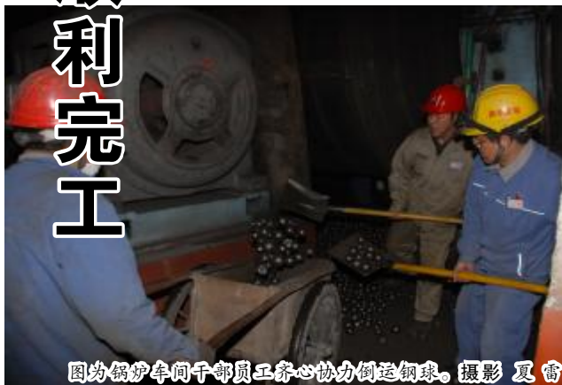
图为锅炉车间干部员工齐心协力倒运钢球。

3月13日,4号锅炉甲侧球磨机因衬板脱落进行停运处理。停运期间,4号锅炉单侧制粉系统运行,严重影响锅炉负荷与稳定燃烧,锅炉车间从人员、负荷、巡检等方面细定措施,确保锅炉稳定运行,杜绝影响氧化铝生产汽电供应。并于14日下午组织干部员工20余人,用时4个小时,将甲侧球磨机钢球倒出,共从球磨机筒体内倒出钢球近30吨,为更换衬板提供了有利条件。同时,晋铝建安公司检修人员轮流作业,加班加点,对4号锅炉甲侧球磨机衬板进行更换,保证了球磨机的安全稳定运行,为锅炉长周期运行打下坚实基础。(张瑞)