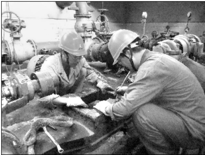
为了保证按期向第一氧化铝厂焙烧炉输送优质合格煤气，热电分厂综合车间抓紧对煤气净化系统、循环水系统设备问题的处理。图为热电分厂综合车间对循环水系统2号竖管泵进行抢修。