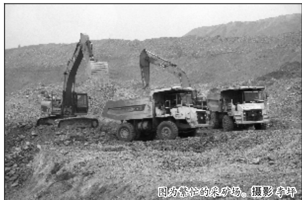
图为繁忙的采矿场。摄影 李坪