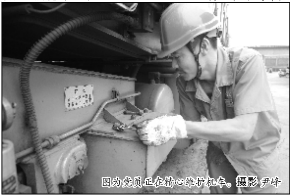
图为党员正在精心维护机车。

在机车备件流向方面,采取“实名签字、交旧领新”制度,并在“省”字上下功夫,把过去定期完全按照以旧换新方式,直接换掉的机油滤清器的滤芯,用柴油洗干净、空干净,装上再用,节约备件费用3000余元。“党员攻关组”自行成功制造出机车加温热交换装置,使去离子水的使用更经济,同时又防止了机车备件被水垢腐蚀,为降低机车检修费用,延长机车寿命提供了保障,为低成本运输探索出新途径。(尹峰 丁剑锋)