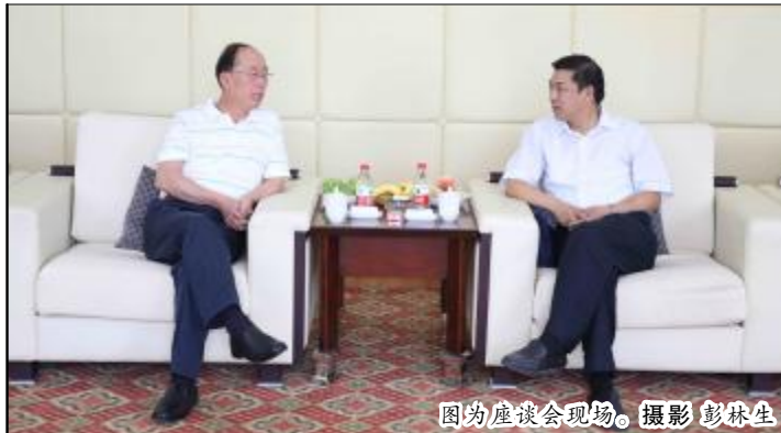
图为座谈会现场。