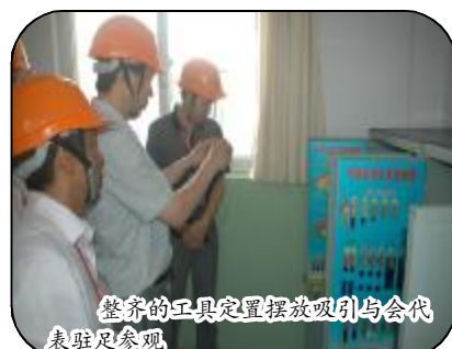
整齐的工具定置摆放吸引与会代表驻足参观