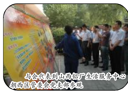
与会代表到山西铝厂生活服务中心朝西区管委会党支部参观