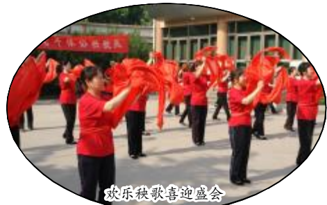
欢乐秧歌喜迎盛会