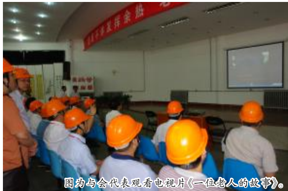
图为与会代表观看电视片《一位老人的故事》。

全场自发响起了雷鸣般的掌声，掌声经久不息，这是发自内心的声音，更是不约而同的声音。