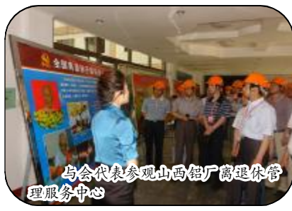
与会代表参观山西铝厂离退休管理服务中心