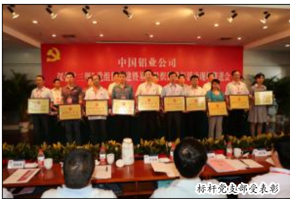
标杆党支部受表彰