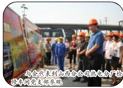
与会代表到山西分公司热电分厂检修车间党支部参观