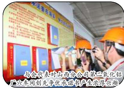
与会代表对山西分公司第三氧化铝厂六车间创先争优承诺书产生浓厚兴趣