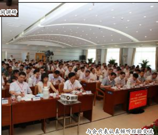
与会代表认真倾听经验交流