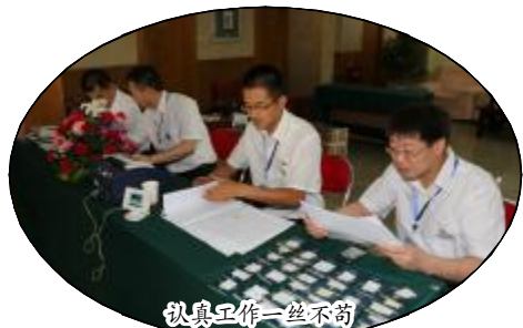
认真工作一丝不苟