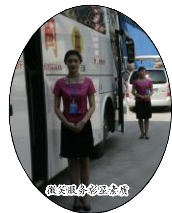
微笑服务彰显素质