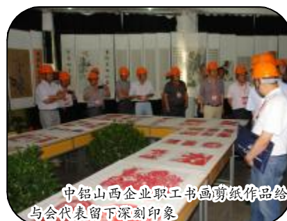
中铝山西企业职工书画剪纸作品给与会代表留下深刻印象