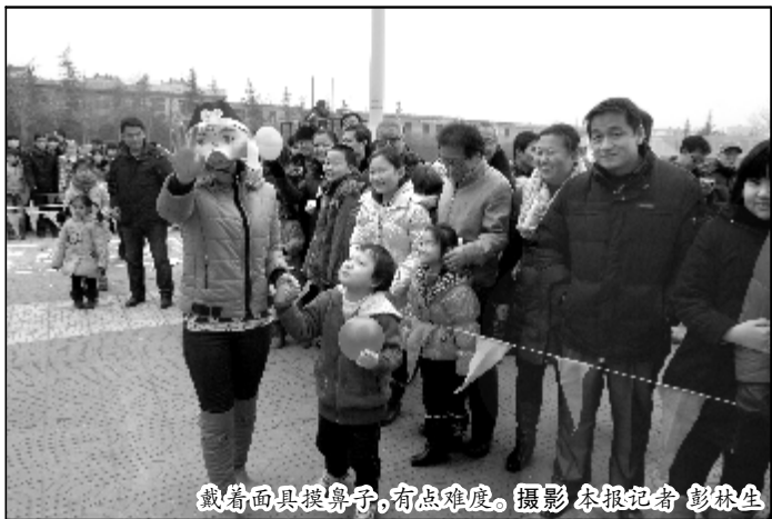
戴着面具提鼻子,有点难度。

开场的《对花枪》是临汾市蒲剧团的拿手好戏,该剧移植了豫剧、评剧、京剧等各剧特色,自成一派,故事情节紧凑,演员慷慨激昂、粗犷豪放的唱腔让戏迷们大呼过瘾。戏曲爱好者李杰看得津津有味。