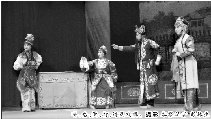
唱、念、做、打，过足戏瘾。