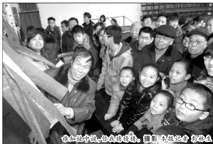
谁知道中谜,你我猜猜猜。

据了解,山西省临汾市蒲剧团从正月十三到正月十六将进行七场演出,满足广大戏迷朋友的愿望。