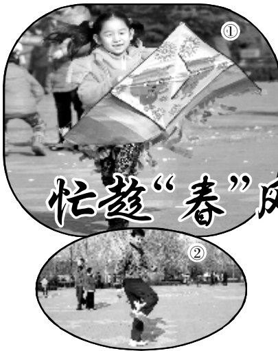
2月4日是二十四节气之首“立春”，人们纷纷来到户外，聆听春的脚步，感受春的明媚。