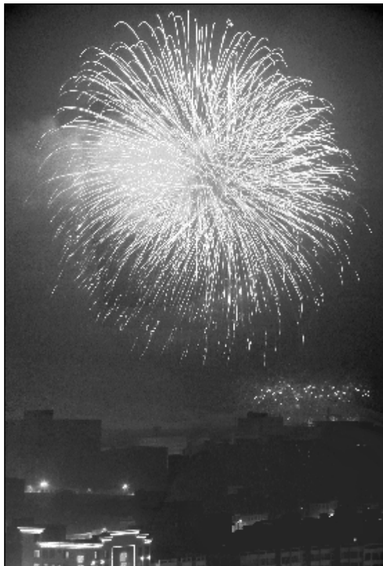
火树银花不夜天