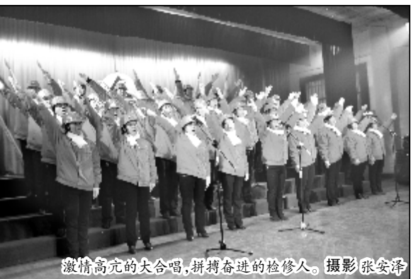
激情高亢的大合唱,拼搏奋进的检修人。

新篇章》讲述奋进的检修人,拼搏的设备卫士先进事迹;职工家属激情歌唱使联欢会气氛高潮迭起,欢声笑语不断,不时博得阵阵掌声。(张安泽)