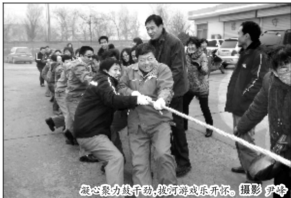
凝心聚力鼓干劲,拔河游戏乐开怀。

本报讯 1月18日下午,技术中心举办了2012年总结表彰及迎新春联欢会。对技术中心评选出的1名优秀车间主任、1名优秀班组长、2名先进工作者和在中心四季度劳动竞赛中表现突出的10名优秀员工和1个先进集体进行了表彰,并播放了为2名道德模范特别拍摄制作的事迹短片,勉励希望先进集体和个人发扬成绩、再接再厉,号召全体员工以他们为榜样,立足本职,扎实工作,为企业和谐发展,为中心各项工作目标的完成而努力。整场晚会精彩纷呈,生动有趣,各车间职工以独唱、合唱、干板腔等形式表达了对完成2012年目标任务的坚定决心。(马飞月)