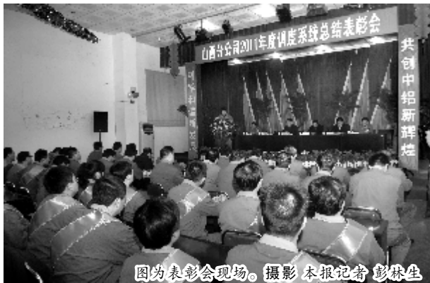
图为表彰会现场。

会议对优秀调度科长和优秀调度员进行了颁奖。受表彰的优秀调度科长和优秀调度员代表分别做了表态发言,表示在新的一年里要进一步眼睛向内挖潜力,消除损失降成本,精心调度创效益。