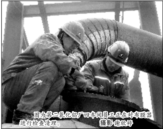
图为第二氧化铝厂四车间员工正在对变频器进行检查清理。

科技化工公司采取多项措施对生产运行进行安排部署。坚持24小时值班制,明确值班人责任;利用班前班后会机会,借助橱窗板报等平台,宣传节日安全生产重要性,教育引导职工安全生产的主动性和自觉性;组织职能科室对车间、工段进行全面检查,确保生产线流程畅通,设备运转正常,安全无隐患。(本报综合报道)