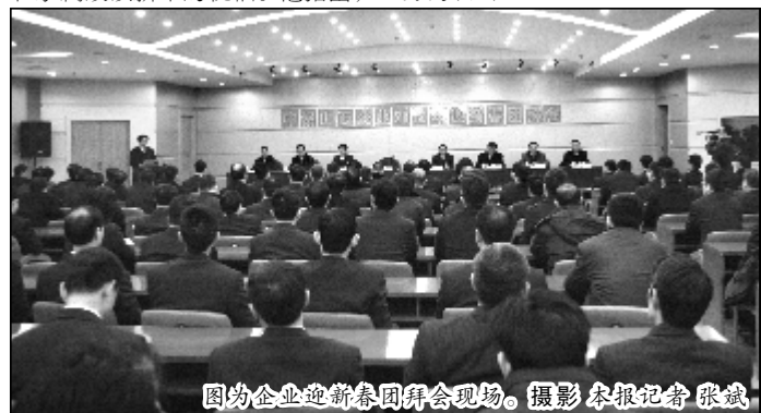
图为企业迎新春团拜会现场。

冷正旭指出,2012年,是企业实施“十二五”规划承上启下的关键之年,也是推进结构调整、加快转型发展的攻坚之年。全体干部员工要坚决贯彻落实中铝公司党组和高管层的决策部署,按照六届二次“双代会”确定的目标任务,突出把握好积极、稳步、求实的总基调,围绕提升生产经营绩效、增强盈利能力的总目标,以运营转型为抓手,以深化改革为动力,以结构调整是关键,以管理创新、科技创新为支撑,以加强党的建设和队伍建设为保障,为全面实现生产经营、改革发展目标和家属致以新年的祝福。他指出,