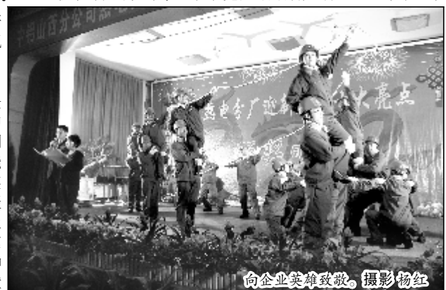
向企业英雄致敬。

艺,鼓舞振奋人心,赢得职工好评。为总结一年来取得的成绩,热电分厂将晚会和亮点表彰进行结合,对分厂亮点工作进行表彰鼓励。“十大亮点”是经过分厂系统推荐、民主投票竞选,代表了热电分厂在生产运营、设备管理、技术创新、运营转型及创先争优等方面取得的良好业绩。老系统锅炉运行周期再创新高、二期锅炉实现达标排放、扎实开展“三岗”活动、设备隐患及厂容厂貌专项整治全面提升煤气板块人员士气、优化制水方式等一个个亮点熠熠,鼓舞人心。(杨红)