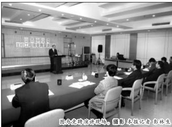
图为竞聘演讲现场。

“天高任鸟飞,海阔凭鱼跃”,我们相信,随着企业的发展以及更多改革措施的实施,将会为科技人员提供更加广阔的舞台,将会有更多的科技人才不断地脱颖而出,我们的企业也必将会在科技创新的推动下实现持续健康的更大发展。