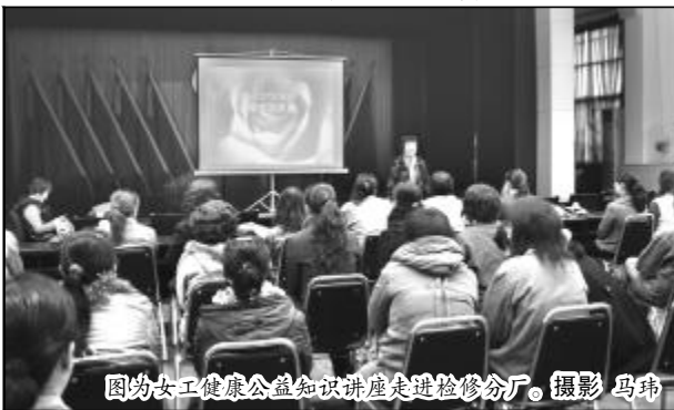
图为女工健康公益知识讲座走进检修分厂。