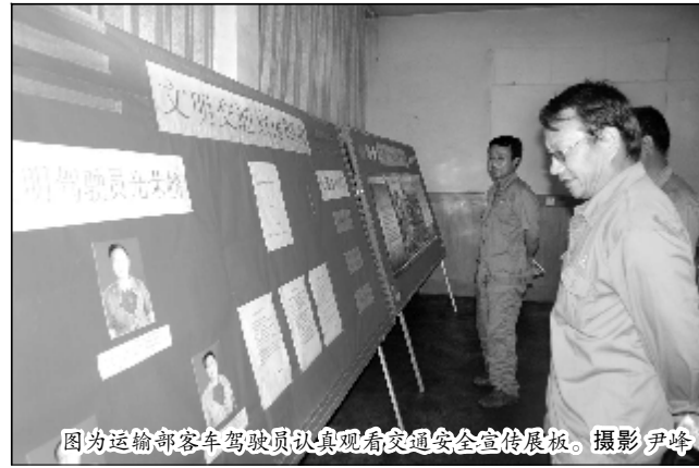
图为运输部客车驾驶员认真观看交通安全宣传展板。