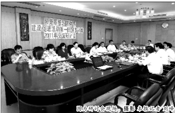
图为研讨会现场。

与会人员观看了山西分公司建立健全物资采购管理体系,不断提高煤炭质量管理水平的宣传片。