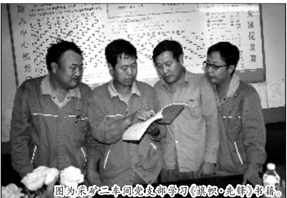
图为采矿二车间党支部学习《旗帜·先锋》书籍。

班子建设是支部的一项重要任务,按照先进基层党组织的“五好”标准,围绕班子建设,支部深入开展讨论,通过民主生活会和班子沟通谈心,使班子成员形成共识:要敢于面对,市场竞争是残酷无情的,需要企业员工群策群力,艰苦奋斗,挖潜增效,才能共克时艰。越是在企业困难时期,越要贯彻实施民主管理和事务公开制度。只有在决策和收入分配方面充分体现公开、公平、公正的原则,才能确保员工的大局意识和主观能动性的发挥。