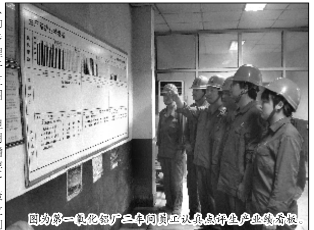
图为第一氧化铝厂三车间员工认真点评生产业绩看板。