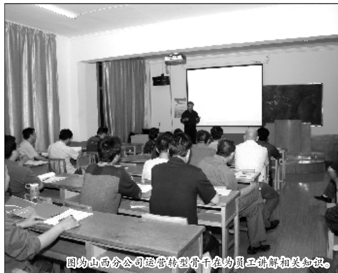
图为山西分公司运营转型骨干在为员工讲解相关知识。

近日,随着高温天气持续,第一氧化铝厂储运车间加强设备岗位点检和专项点检及设备消缺工作,对电机、减速机等设备可能发生的高温、振动大等异常状况进行检查,确保设备安全度夏。图为员工检查减速机轴承。