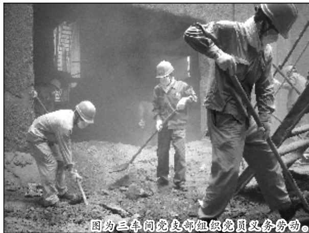
图为三车间党支部组织党员义务劳动。

动。随着创新串联法的逐步深入,熟料窑运行指标的优劣对拜耳法和烧结法的生产组织都会造成明显影响,支部找准这个突破口,制定出了产量、质量指标的各个阶段性目标,在作业区之间开展竞赛活动,极大地促进了岗位员工保质量、提产量的积极性。今年以来,熟料窑烧结质量保持稳定,月均黄料时间控制在每班每台15分钟,熟料窑实际下料量稳步提高,基本保持在每小时73立方,个别月份达到了每小时75立方。