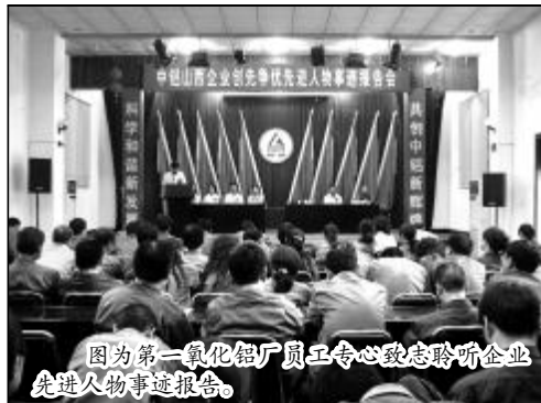
图为第一氧化铝厂员工专心致志聆听企业先进人物事迹报告。