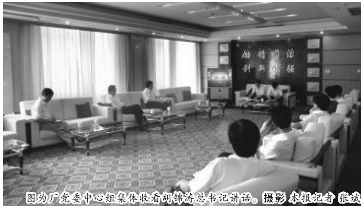
图为厂党委中心组集体收看胡锦涛总书记讲话。