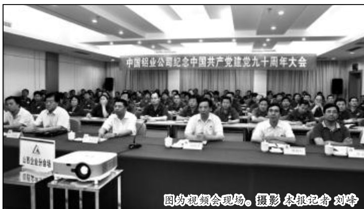
图为视频会现场。

本报讯 7 月 1 日，中铝公司召开纪念建党 90 周年视频会，回顾党的光辉历程，总结公司党建工作和创先争优开展情况，表彰公司标杆党支部和标杆共产党员，发布公司 2010 至 2011 年度优秀党建思想政治工作研究成果，动员广大党员干部锐意进取、团结拼搏，扎实工作，为全面完成全年各项任务努力奋斗。