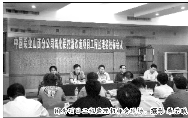
图为项目工程监理招标会现场。

为实现“低成本同行领先、高标准方案优化、高质量优质工程、高效率快速建成”的项目建设目标,在氧化铝挖潜改造项目建设阶段,指挥部将强化现场组织,强化质量管理和投资控制,确保项目 2012 年 9 月全面建成,为分公司再造竞争新优势,为中铝公司建设最具成长性的世界一流矿业公司做出积极贡献。