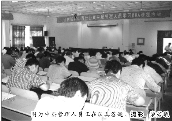
图为中层管理人员正在认真答题。