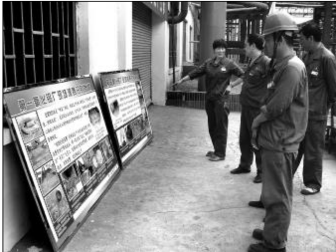
图为员工观看消除浪费样板版面。