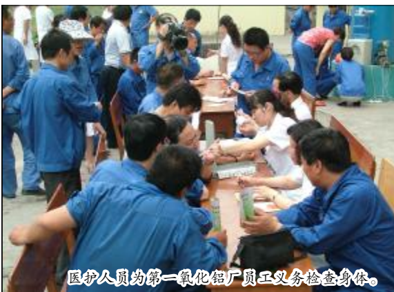
医护人员为第一氧化铝厂员工义务检查身体。

送医到一线是职工医院深入推进创建“三型”党组织系列活动之一。自5月份以来,职工医院以强化综合辅助能力为核心,开展了提高医务人员业务水平的“岗位培训、岗位练兵、岗位竞赛”推进会,以及糖尿病防治知识专题讲座等系列活动。据了解,为了进一步做好“支持保障型”辅助系统党组织工作,职工医院将利用半年左右时间,组织医务人员送医送药到生产一线,为员工健康保驾护航,使一线员工在岗位上就能享受到高质量的医疗服务。(范军枝)