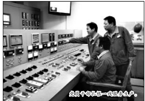
党员干部扎根一线服务生产。

锅炉车间党支部确立了“锅炉零灭火”的献礼项目,积极探索开展“创新创新型”党组织活动。车间27名共产党员签订承诺书,开展了“立足岗位做贡献,创先争优展风采”活动。化学车间党支部将争创山西分公司标杆