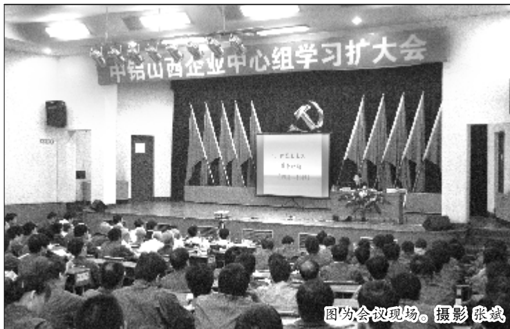
图为会议现场。

祝彦教授以“中国共产党 90 年历程与启示”为主题,按照“新民主主义革命时期”、“新中国建设与社会主义探索时期”、