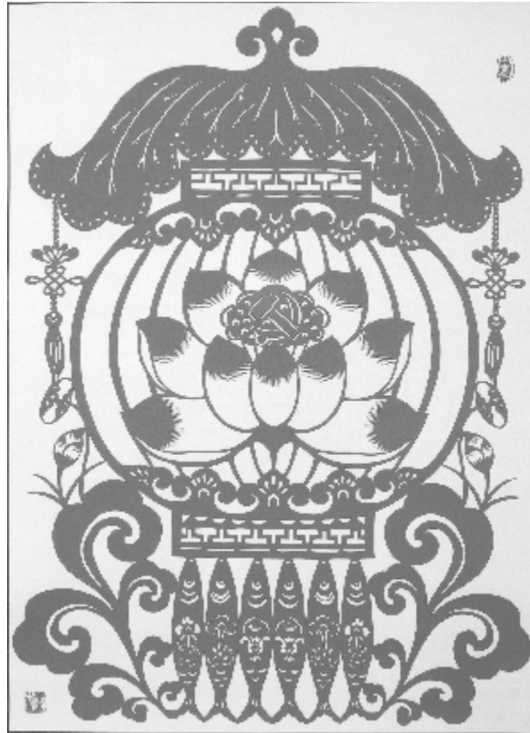
党的光辉永照山河 剪纸 宁秦香