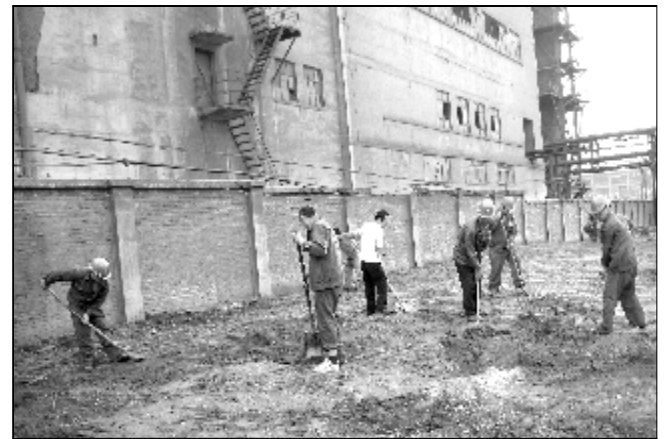
近日,热电厂管道车间组织30余名党员骨干,对热电厂厂区七号路路边的杂草、杂物和土堆进行了铲除和平整。经过4个小时的努力,车间共整理300余平米,整理杂草、杂物、废土50余立方,营造出更加美好的厂区环境。

职工医院召开“岗位培训、岗位练兵、岗位竞赛”推进会,就开展“三岗”活动进行安排部署,对参会人员进行了“护理艺术在临床工作中的应用”培训。职工医院紧紧围绕“基本理论、基本知识、基本技能”组织了形式多样的岗位培训、岗位练兵、岗位竞赛活动。今年以来,职工医院共组织业务学习19次,青年医师轮流讲课15次,病案讨论4次,操作培训20次,业务考试10次,技术比武2次,外请专家来院授课4次,外出进修4人次,参加卫生系统各类培训学习13次,努力提高医务人员服务企业干部员工的综合能力和业务水平。推进会上,职工医院还就创建“三型”党组织活动进行安排部署。(张利 史旭英 范军枝)