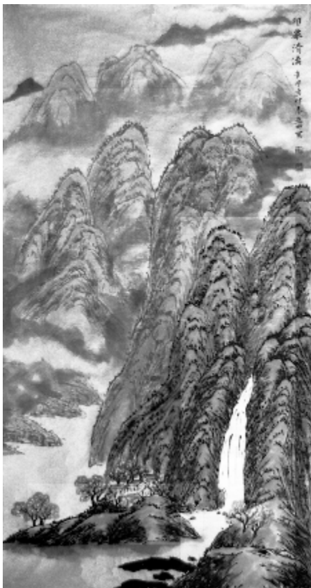
印象清漓 国画 董亚卿