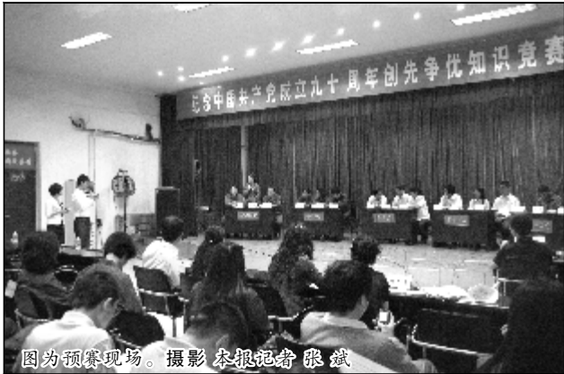
图为预赛现场。