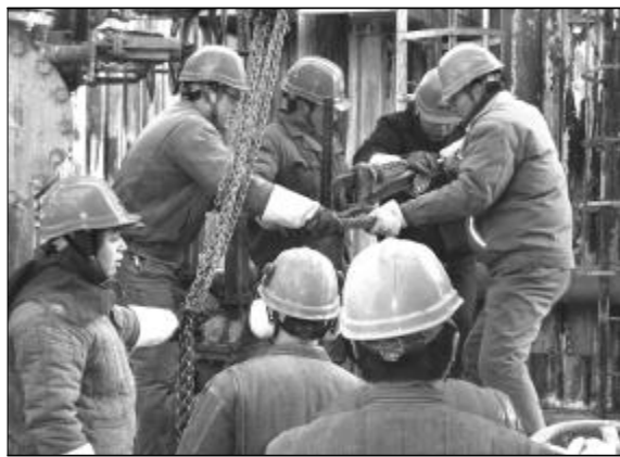
员工合力检修设备。

为了实现“红线”目标,第二氧化铝厂制定了节能降耗措施,将消耗指标可控部分的煤气、电耗、蒸汽、新水四