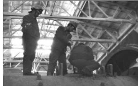
图为第一氧化铝厂员工按照操作规程点检设备。

如今,中铝山西企业基础管理正不断推向深入,在生产经营和改革发展中发挥着巨大作用。企业各单位和广大干部员工充满信心,决心按照中铝公司的要求,通过三年左右的时间,使基础管理对制造成本的贡献率达到2.5%以上,实现企业“再造竞争新优势,科学发展上水平”的宏伟目标。