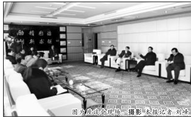
图为座谈会现场。

2010年,中铝公司、山西铝厂与路鑫集团共同注册的鑫峪沟煤业集团,获得煤矿整合主体资格。山西铝厂与路鑫集团合作的煜业公司年产300万吨重介选煤项目、晋铝兴业4×6000千瓦的自备发电厂项目、年产1万吨氮化硅和年产2万吨高铝刚玉项目均投产达效,形成了完整的产业链。