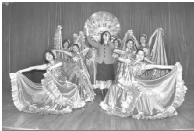
图为生活服务中心员工表演的歌伴舞《我和我的祖国》。