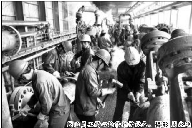
图为员工精心检修维护设备。