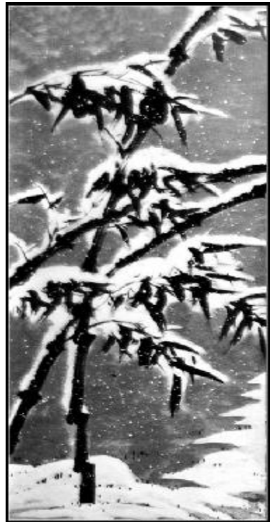
雪压冰凝见精神 国画 郭学斌