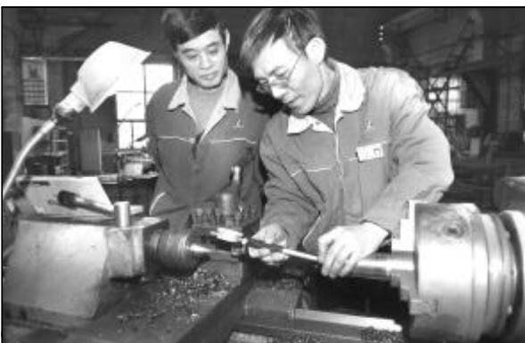
图为检修分厂党员优化加工工艺。

工作时间，全体党员统一佩戴党员标识牌，亮明党员身份，接受群众监督。企业创先争优活动园地，各二级党组织创先争优公开承诺书和创先争优人注目。山西铝厂党委在传承党员责任区、共产党员机台、党员先锋岗等好做法、好载体的同时，创新设立支部创先争优、党员争优秀，每月评比，上墙公示，鼓励先进，激励后进，形成了比学赶超的工作格局。第一氧化铝厂积极开展“红旗机台”竞赛活动，成立了党员突击队；80万吨氧化铝厂对党员干部实行“红、黄”两面旗管理，层层传递压力，激发工作动力；水泥厂党总支坚持开展每季评选一个优秀党员责任区、一个优秀共产党员机台、一个党员先锋岗的“三个一”活动，争创“三面