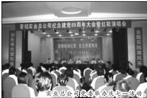
实业总公司党委举办七一活动。

以中心组学习为深化理论武装的平台,全年为党员干部购买各种政治和业务学习书籍近百册,组织两级中心组学习42