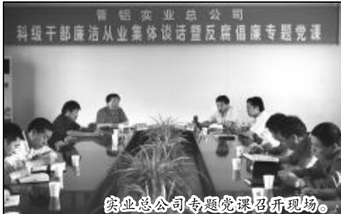
实业总公司专题党课召开现场。

2010年,公司党委被中国铝业公司党委授予“先进基层党组织”荣誉称号,涌现出运城市“工人先锋号”、运城市劳模、山西企业劳模及山西企业优秀共产党员标兵、优秀党务工作者和十佳青年等先进典型。在坚强团结、百折不挠的领导班子带领下,公司上下同心迎挑战,携手并肩谋发展,经营绩效稳步增长、管理改革扎实推进、安全生产态势良好、职工队伍稳定和谐,较好完成了年度各项目标任务。