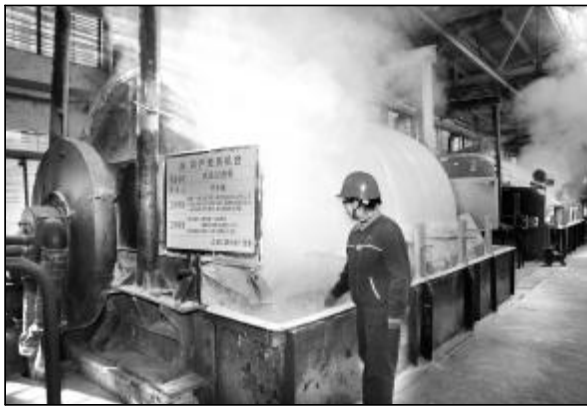
图为党员在岗位上认真巡检。

企业创先争优活动得到了各级领导的充分肯定。中组部副部长王秦丰在企业调研时，对企业创先争优活动开展情况给予高度评价，称赞企业通过深入学习实践科学发展观活动，战胜了金融危机带来的重重困难；以开展创先争优活动为契机，积极应对后危机时代的严峻挑战，表示相信企业一定能够战胜困难，赢得更大的发展。