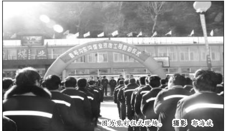
图为剪彩仪式现场。