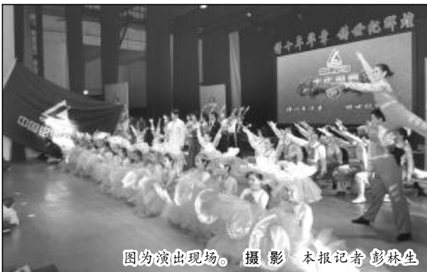
图为演出现场。

演出开始前,郭顺喜代表驻晋五家企业致欢迎词,向演出团表示热烈欢迎和衷心感谢。他说,在中铝公司党组的坚强领导下,在山西省和运城、天津两级市委市政府的大力支持下,中铝驻晋企业在市场磨练中不断发展壮大,有力促进了地方经济发展。尤其是在刚刚过去的2010年,各企业坚决贯彻执行公司党组的决策部署,直面挑战,奋发图强,各项工作取得显著成绩。此次巡回慰问演出不仅送来了精彩纷呈的文艺节目,更送来了公司党组对广大干部职工及家属的深切关怀和亲切慰问,必将进一步鼓舞干部职工的斗志,增强战胜困难的信心。