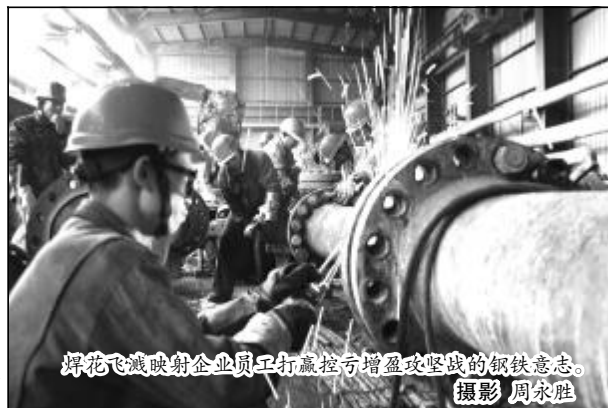
火花飞溅映射企业员工打赢控亏增盈攻坚战的钢铁意志。

控亏增盈成绩来之不易。这得益于中铝公司党组的坚强领导和企业领导班子的正确决策,凝聚着全体干部员工的心血和智慧。在这个成绩的鼓舞下,全体干部员工正凝心聚力,奋发图强,共同创建企业“十二五”更加辉煌的明天。