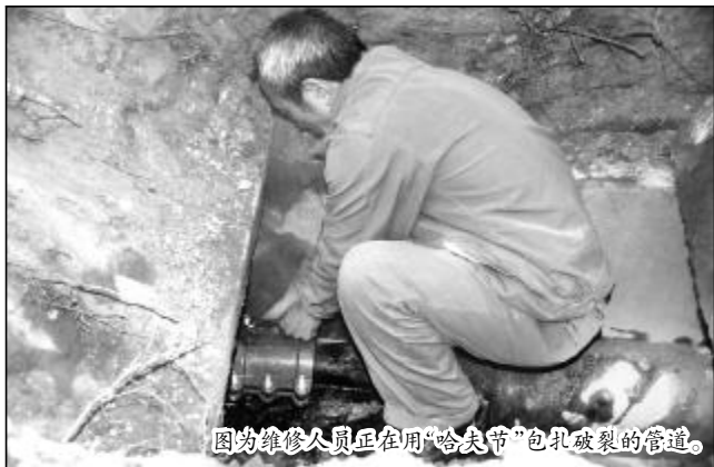
图为维修人员正在用“哈夫节”包扎破裂的管道。