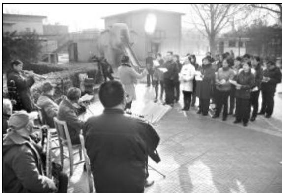
图为生活服务中心员工和小区居民共同唱响红歌。

用歌声重温发展历程,用歌声唱响企业辉煌。在这铿锵有力的红歌中,历经风雨洗礼的中铝山西企业昂首奔向新的征程。