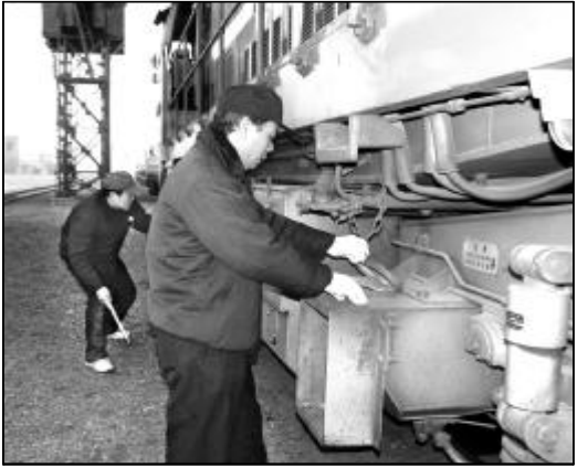
图为乘务员认真点检机车。

“以前,机车油耗基本控制在百升左右,但哪个环节消耗多少,没有具体数据。”运转车间主任原发介绍,“自部里下达‘红线’目标后,我们就把完成‘红线’目标当成