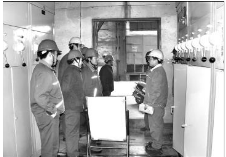
为建立有效的防范和处理电气停电事故工作机制,进一步提高电气作业人员处置停电事故的应急能力和操作技能,12月17日,第二氧化铝厂在BD-26B、C配电室进行了电气停电反事故演练。图为演练人员模拟处理配电室故障。

提出改造方案;派专业技术人员到抚顺石油化工有限公司热电厂、辽宁能港发电有限公司实地考察,确认WRKT-III型双通道煤粉燃烧器是解决锅炉燃烧不稳定的有效方法。同时,分厂利用4号锅炉大修的时机,对锅炉喷燃器进行改造,分厂技术科对喷燃器在各种工况下试验性能进行对比,证明喷燃器稳定可靠,低负荷稳燃性能良好,达到预期目的。(李兆文)