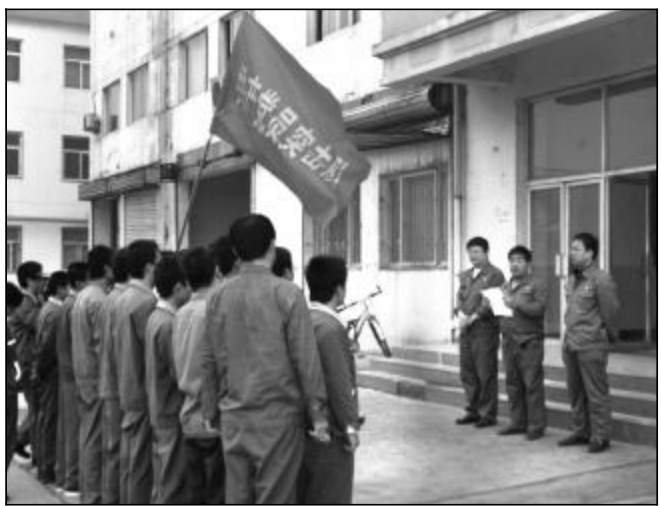
近日，2.6万吨氧化铝厂在综合车间抽调党员、入党积极分子，成立党员突击队。分厂要求突击队充分发挥先锋模范作用，争当“四优”共产党员，带领干部职工解放思想、转变观念、促进发展。

第二氧化铝厂党建电子档案规范有序的条目、制作精致的页面以及科学便捷的资料链接给参观者留下了深刻印象，大家对制作设计、创先争优特色工作等方面的问题进行了咨询、记录，表示将以此作为模板，进一步规范支部电子党建档案管理，创新创先争优活动载体，推动创先争优活动扎实开展。参观人员还先后参观了第二氧化铝厂党建活动园地、党员承诺园地、焙烧一车间支部建设园地等。（张利 王丽华 高进）