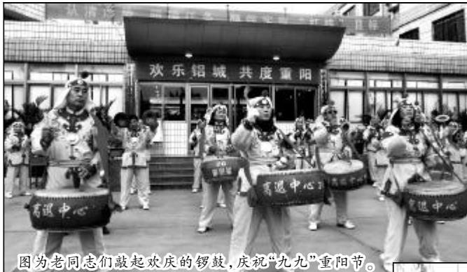
图为老同志们敲起欢庆的锣鼓,庆祝“九九”重阳节。