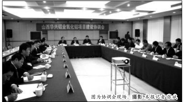
图为协调会现场。