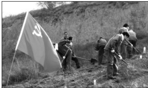
图为营销中心第一党支部组织党员义务清理石矿配送站炸药库周边杂草。

2008 年底，在分公司实行弹性生产，原物配中心取消劳务用工、从原综合科和计划调度科两个科室抽出 30% 的人员成立工效组、各项费用十分紧张的情况下，一支部全体党员积极转变观念，解放思想，按照“六个非常”要求，在没有加班报酬、收入下降的情况下，充分发挥主观能动性，做到一人多岗，一人多能，不仅坚持做好本职工作，而且兼职门岗值夜班，装卸、包装氢氧化铝，铝矾土、煤炭卸车，炸药库杂草清理，铁路线清理等额外工作，与企业共担风雨、同舟共济，全面完成了各项工作任务。