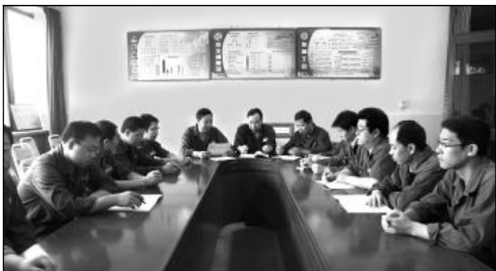
中心一车间党支部组织党员政治学习。

今年以来，一车间党支部扎实开展“三创两保一促”主题实践活动，引导党员充分发挥积极性和主动性，降低消耗，节约成本，修旧利废节约费用 6.2 万余元。