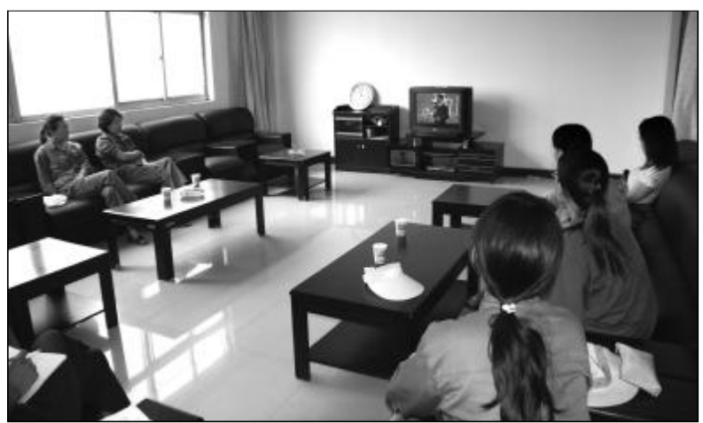
为做好企业当前形势任务的正面宣传引导工作,增强干部员工打赢控亏增盈攻坚战的信心和决心,7月28日下午,热电分厂组织车间宣传员进行了形势任务培训教育,进一步提高基层宣传员的业务能力和工作热情,为坚决完成“红线”目标鼓与呼。图为宣传员正在观看《为自己工作》的光碟。

在当今倡导“环保、低碳”的时代里,一项科学新技术、新工艺的产生和应用,不但应降低生产成本、节约能源资源,而且得达到造福社会、提高人们生活质量的目,只有这样的新技术、新工艺才能符合当今人类社会发展的需要。山西分公司第二氧化铝厂本着这样的原则,逐步探索“焙烧炉烟气余热回收利用新工艺”,经过半工业生产的多次试验,完善了工艺条件和要求,使其投入工业生产应用成为可能,也为山西分公司降本增效开辟出技术创新的新路子。