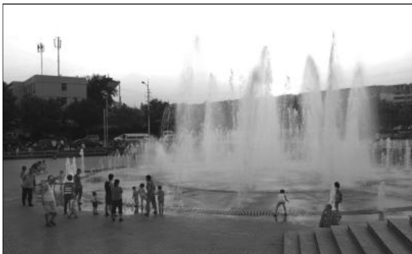
▲太阳尚未落山，人们便迫不及待地奔向喷泉广场，与清凉的水亲密拥抱。

近日，铝城再次遭遇35℃以上的高温“桑拿”天气。河津市气象部门预报，高温天气还将持续一段时间，在此，我们提醒铝城广大职工家属：要尽量减少户外活动，注意休息，多补充水份，做好防暑降温工作。