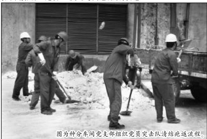
图为种分车间党支部组织党员突击队清结返流程。

典型，引导职工比学赶超。车间一名技术骨干，在生产组织被动时期和急难险重任务面前，几天几夜不离岗，全力以赴解决生产难题，支部及时对其进行表扬，总