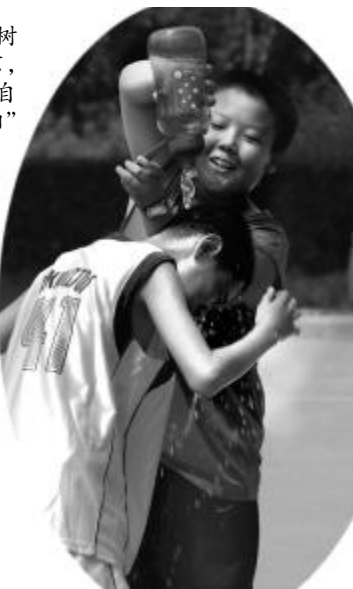
▲我们是快乐的“美人鱼”精灵。