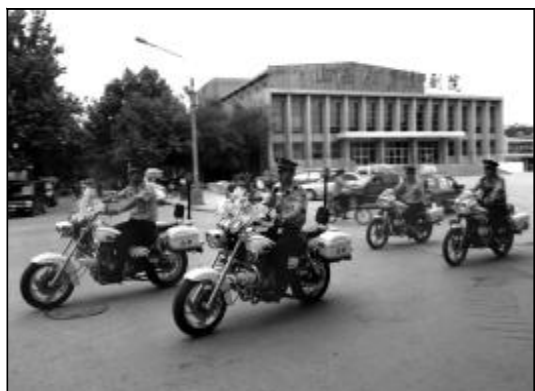
▲嗨，人家公安那可是真功夫，咱学不了，还是打把伞遮阳吧。 ▲高温酷暑，公安干警依然全副武装，守护着铝城的平安。