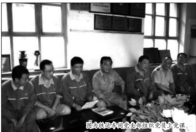
图为铁运车间党支部组织党员上党课。

生产运输遵循科学，实现良好经济效益。 2008年四季度以来，面对铁路运力不足的情况，支部一班人抓住铁路增运补欠有利时机，科学合理组织高产，在车辆到位的情况下，2008年9至12月，实现运矿68万余吨，月均供矿17万吨，创历史最好水平。为全面完成“挖潜增效、控亏增盈”目标，该支部将成本指标层层分解，细化到每一公斤油，每一吨水，可修的备件绝不更换，牢固树立“降成本就是保生存”的理念，成本指标得到了有效控制，2009年节约各项费用10万元；在安全管理上，支部组织开展了长周期安全文明生产劳动竞赛，积极与国铁安全管理对标，截至2010年5月25日，车间实现安全行车无任何责任事故815天；在设备管理上，推行维护重于检修的理念，设备运转率、完好率实现了矿控指标；在基础管理上，注重制度的可操作性、规范性和严密性，定制度抓落实，强化执行力，使车间整体管理更加规范。