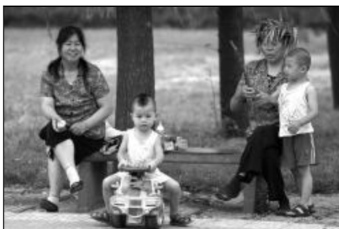
▲大树底下好乘凉，再戴一顶自制的“遮阳”帽，好享受！ ▲热？来一个“人工降雨”，感觉不错吧！