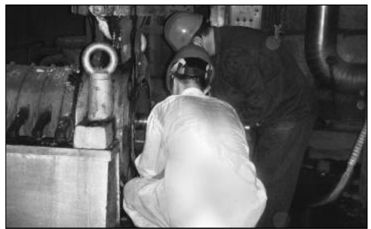
近日,热电厂提前3天完成5号给水泵大修工作,经过调试,各项参数指标均达到技术要求,一次启动成功。图为员工正在拆卸给水泵。