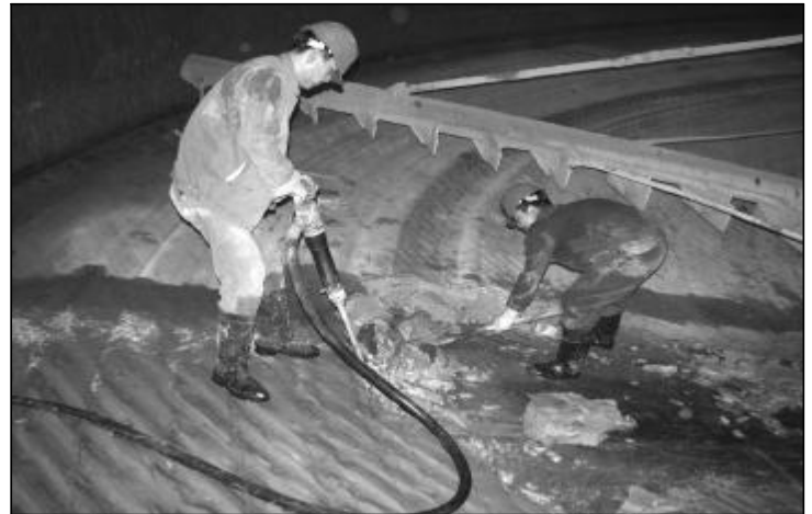
近日,第一氧化铝厂组织人员对洗涤车间4号沉降槽结疤展开突击清理。参战员工冒着高温,加班加点赶进度,确保高质量、高水平的完成任务,为烧结法稳定运行创造条件。图为员工正在清理结疤。

此外,职工医院还积极履行社会责任。在3.28王家岭煤矿透水事故中,医院反应迅速,积极参与救治工作,受到社会各界一致好评,为中铝公司和山西企业赢得了荣誉。