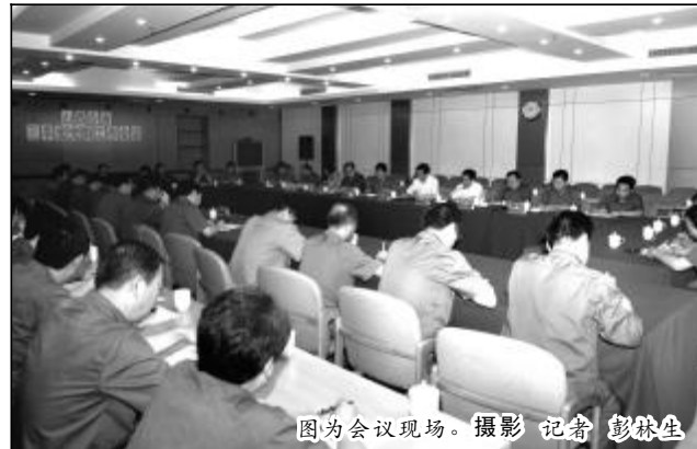
图为会议现场。