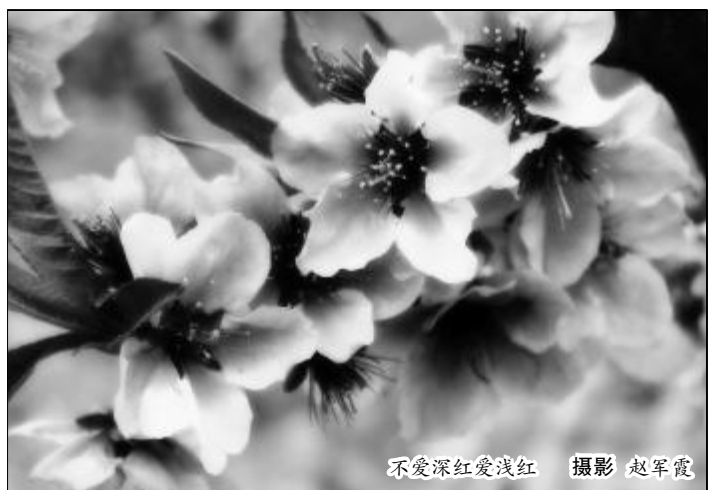
不爱深红爱浅红