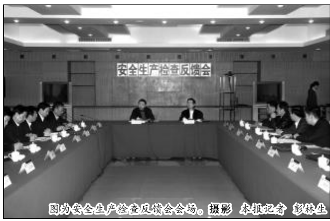
图为安全生产检查反馈会会场。

本报讯(记者吴建华、张斌)为贯彻落实中铝公司4月7日安全生产电视电话会议精神,4月15日至17日,由中铝公司党组成员、副总经理刘才明带队,中国铝业企业管理部总经理冷正旭、企业管理部统计计划处处长武卷英、战略发展部综合处