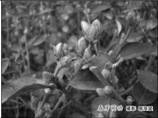
春芽萌动

（退休职工、党员荆喜运利用离退休管理服务中 心被秀区第二党支部学习日活动，参观山西铝厂展厅有感，遂赋诗一首。）