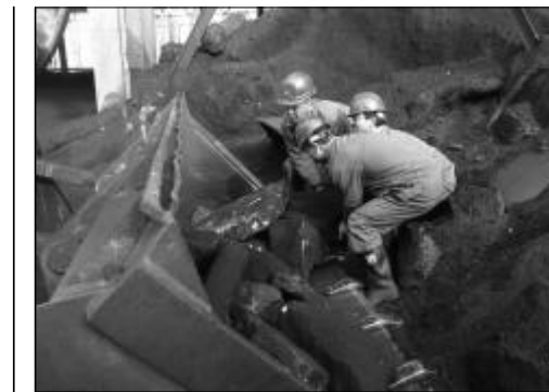
为了进一步强化降本意识,实现颗粒归仓,营销中心利用一周时间对80万吨煤堆场进行现场清理,从废弃垃圾中清理、筛选、分离出原煤近60吨,节约费用3万余元。图为燃料检验科员工正在清理煤场石块。

第一氧化铝厂在推行工时制当中,并不是一味拉大职工收入差距,造成新的矛盾,而是坚持做到有利于提高职工的积极性,有利于提高检修工时效率,有利于提高设备保障水平。这样,使以前愿意干活的,以前偷懒的也转变观念积极投入工作,促进了工时制的平稳开展和推行目标的实现。在实施中,综合一车间提出所有的活让所有的人去干。这样,原来只维修空压机的检修工,可以到翻车机焊接下料算子,可以到80万吨氧化铝进行倒组,在综合二车间,只要打开电脑就能掌握到各队检修工作的落实和工时得分情况。综合三车间做到了派活、统计、协调、考核一条龙管理,各队之间的总体工作量基本保持平衡,使愿意干活的人都能拿到工时,提高了职工的积极性。在2月份底的高压溶出检修中,3个综合车间比干劲、比工期、比质量,顺利完成各项任务。在106沉槽槽的清理中,2000立方米的清理量,原来需要一个多月,现在10日之内顺利完成。3月10日开始的5号大窑的清理中,综合二车间把任务分解到人头,核定出工时,提前24小时完成了全部清理量,为大窑检修赢得了宝贵时间。满眼春风扑面来。工时制的推行,有效提高了职工的积极性,提高了检修质量、工时效率和设备保障水平。在前进的路上,“工时制”沐浴着改革的春风,已经在第一氧化铝厂扎根发芽,并且会愈来愈显现出其蓬勃向上的生机和活力!