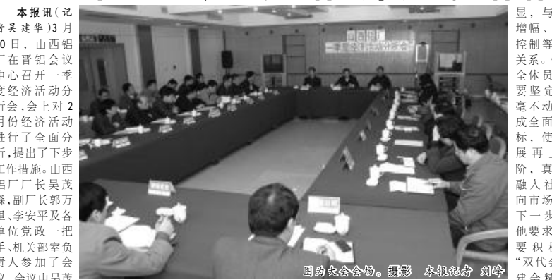
图为大会会场。

本报讯（记者吴建华）3月20日，山西铝厂在晋铝会议中心召开一季度经济活动分析会，会上对2月份经济活动进行了全面分析，提出了下步工作措施。山西铝厂厂长吴茂森，副厂长郭万里、李安平及各单位党政一把手、机关部室负责人参加了会议。会议由吴茂森主持。