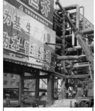
3月11日,第二氧化铝厂检修二车间进行碱洗流程改造,检修人员在吊车配合下更换管道。此次流程改造完成后,可进一步减低劳动强度,提高设备运转率。

本报讯 近日,石灰石矿重型车间对3台T220大型推土机进行首次自主维修,现已试车成功投入运行,节约维修费用数万元,在积累维修经验的同时,大幅提高了设备自主维修能力。 为改变大型机械设备维修受厂家制约的局面,最大限度地降低维修费用,年初,石灰石矿重型车间组织技术人员、推土机司机反复研讨论证,决定对3台T220型推土机进行自主大修。维修中,大家克服技术资料不全、春节期间备件供应困难等不利条件,邀请专业技术人员现场指导,检查处理了变速箱、变矩散热器等,更换了工作泵、液压装置等部件,有效解决了铲刀提升缓慢、行走颠簸等问题。目前12号、13号推土机已经投入使用,运行状态良好。(石头)