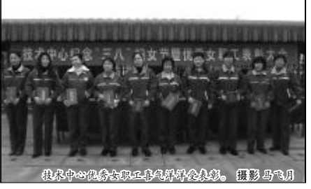
技术中心优秀女职工风采展示会表彰。