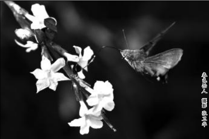
春色怡人

—写在“三·八”妇女节之际 ●雪竹 你们用勤劳营造幸福 你们用平凡维护和谐 你们用温暖的胸怀 你们用汗水浇灌美丽的春天 你们用质朴的爱 你们用大爱