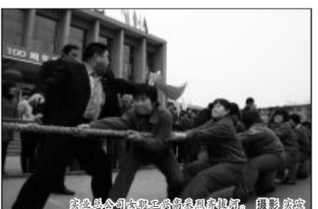
铝业总公司女职工共庆妇女节联欢。

“质量”是什么?单纯的质量从物理学角度来讲,它是物体的一种属性,而如今,现代人又赋予了它新的概念与涵义。“你的工作质量如何,你的生活质量高不高”等等,质量一词如今随处可见,随手可拈。