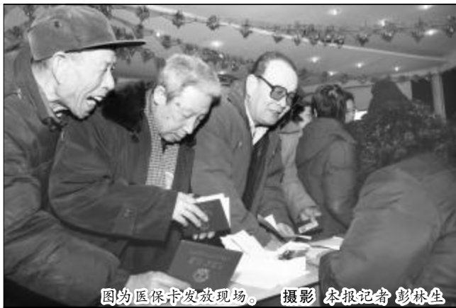
图为医保卡发放现场。

基地的企业非从业居民也感受到了来自党和政府的关怀,虽是数九时节,天寒地冻,但职工家属个个脸上都洋溢着发自内心的喜悦。 代办医保卡发放工作的离退休中心(社保部)早早做好了准备,工作人员有的中午回家匆匆吃口饭就赶了过来,有的干脆办公室里一份盒饭解决问题。为了将医保卡及时发放到广大家属手中,让大家吃上一颗定心丸,工作人员22日一大早就忙活起来,精心细致地做着各项准备工作。首批1424份医保卡,逐一进行身份信息核对,将医保卡按照姓氏分类统计,同时通知医保卡领取时间,布置发放现场,将发放现场按居住区域进行了划分,方便家属简洁、快速领取。