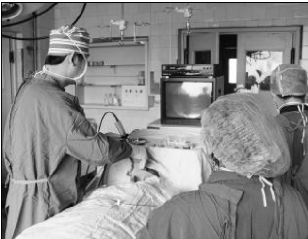
图为西安专家正在进行鼻窦内窥镜手术。

职工医院引进鼻窦内窥镜手术,使患者在家门口就能享受到西安专家的诊治,既方便了患者,又为患者节约了开支,受到患者及家属的好评。