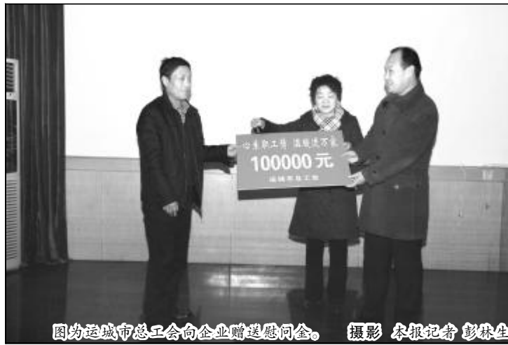
图为运城市总工会向企业赠送慰问金。

作用,在金融危机非常时期组织召开第四届职工文化艺术节鼓舞士气、凝聚人心给予充分肯定。当了解到企业正在进行中铝山西企业中层干部竞聘、选任时,荆青莲指出,工会要扎实开展工作,发挥职工之家作用,要关心中层干部,特别是岗位变动的干部的思想动态,让他们感受到党的温暖,感受到工会的温暖,要切实当好职工“娘家人”,为职工解难,为企业分忧。 荆青莲一行在山西铝厂工会共青团工作部负责人的陪同下专程看望了原山西铝厂工会主席杨彰德。