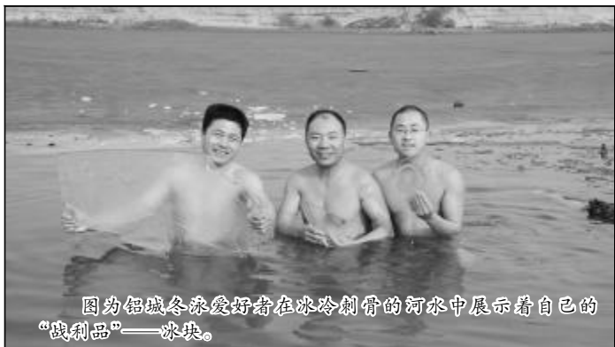
因为铝城冬泳爱好者在冰冷刺骨的河水中展示着自己的“战利品”——冰块。

据悉,“全国冬泳日”从1996年元旦开始,已经连续举行了15届,是国家体育总局实施《全民健身计划纲要》固定活动中的重要组成部分。