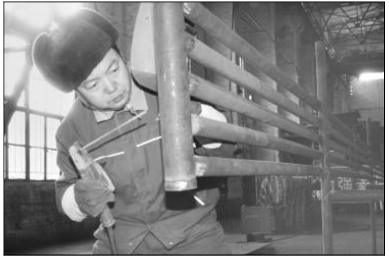
近日,由检修分厂承担的高压溶出109压煮器大修工程进展顺利。为了延长压煮器生产运行周期,检修分厂预制了更换所需管排,在制作过程中安排专人进行质量把关,保证了管排的焊接质量和探伤合格率。图为检修员工精心进行管束预制。

此次检修有助于进一步提高生产系统的高效稳定运行,降低生产成本,为圆满完成生产经营任务起到积极促进作用。(周永胜)