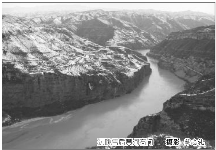
远眺雪后黄河石门