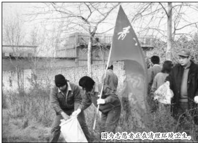
图为志愿者正在清理环境卫生。

本报讯 在12月5日第25个国际志愿者日到来之际,中铝山西企业第二青年工作协作区举行志愿者活动,纪念这一日子的到来。12月4日,来自第二青年工作协作区的30余名志愿者,对80万吨氧化铝厂和煤气分厂交界道路(原2号路)两旁的环境卫生进行彻底清理。志愿者们冒着寒风,认真清理道路两旁的垃圾、杂草,美化了厂区环境,体现了志愿者的奉献精神,以自己的实际行动,迎接第25个国际志愿者日的到来。(金海波)