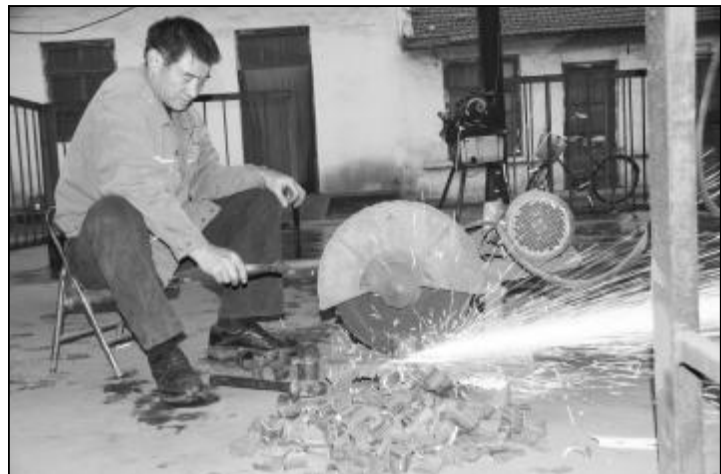
管道“卡子”在处理管道漏点中具有省时、省力、经济、高效等诸多优点。近日,东兴物业部维修中心人员就利用收集的边角料自制管道“卡子”,以满足生活区管道堵漏的需求。图为维修中心人员正在打磨毛坯“卡子”。

交接站 1、2、3 道 4000 余副胶垫的更换,紧固螺栓 3000 余个;更换进厂 1、2 号线及企业站西岔区道岔钢轨 9 副,更换了 1、2 期翻车机全部 600 米的上股钢轨,同时对交接站北岔区进行了全面修整。在完成线路冬季检修任务的同时,工段还配合完成了两项外委线路的施工任务,确保冬季铁路运输安全生产。(樊雨平)