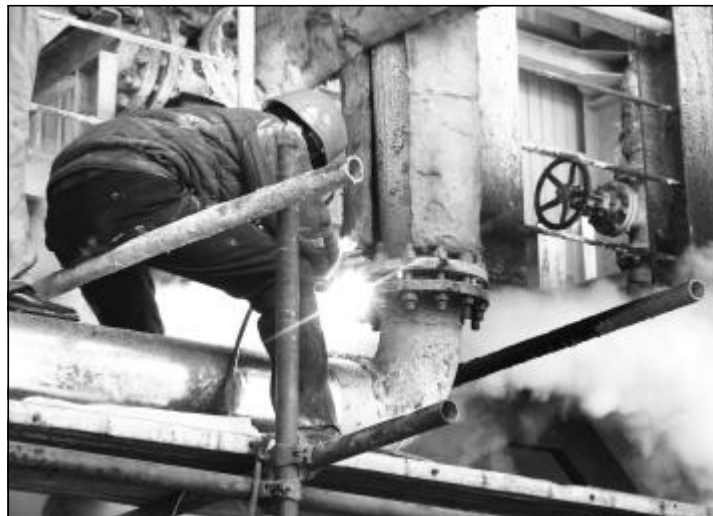
图为施工人员冒着高压蒸汽实施堵漏。

在完成带压堵漏任务中,检修分厂组织技术人员对现场进行了检测。为避免系统停车检修,降低氧化铝生产成本,检修分厂制定了科学的施工方案,专业施工人员利用自制的堵漏专用夹具,仔细清理管道连接法兰,在克服了不利因素的影响,连续实施了 6 小时的抢修后,完成了带压堵漏任务,保证了氧化铝生产低成本正常运行。(寻向民)