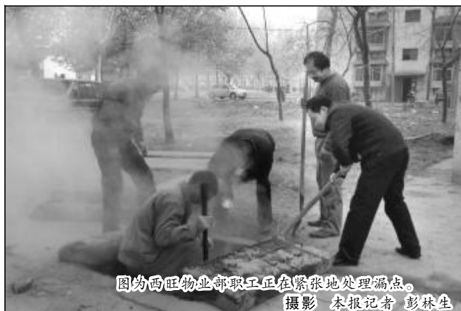
图为西旺物业部职工正在紧张地处理漏点。