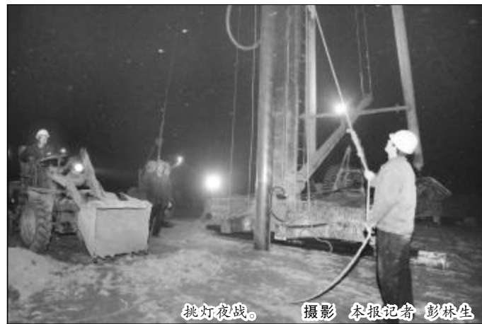
挑灯夜战。

质量是基础,尤其是当前正在基础处理阶段,地基的质量更决定了楼房的牢固与否,所以晋铝建设一直把质量管理作为重中之重。裴新刚告诉记者:“受雪天影响,天气比较冷,提前进入了冬季施工阶段”。在时间上,项目部进行了合理安排,避免晚上进行混凝土施工;在材料上,进行了充足的准备,防冻剂、棉毡、草甸等防冻物资已经到位;在技术上,对混凝土施工已经采取防冻处理和保温措施。与此同时,晋铝建设严格质量管理,实行旁站监督,一台打桩机两个人,轮流值班,并制定了严格的考核措施。在现场,穿着羽绒服的我们依然感受到冷空气的不断侵袭。(下转第二版)