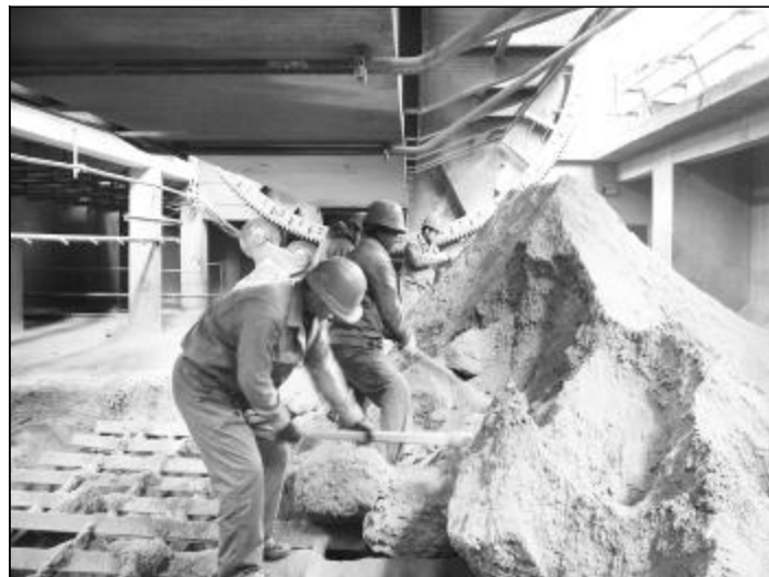
11月18日,受严寒天气影响,进厂铝土矿中有大量冻块,给氧化铝一分厂翻车供料带来困难,一分厂积极组织员工对冻块进行破碎和清理,确保正常生产需要。图为员工在二期翻车机下破碎铝土矿冻块。

为保证检修过程安全有序,80万吨氧化铝厂对检修工作进行周密部署,严密安排检修节点,按照谁主管、谁负责的原则,要求每一项检修任务均有专人协调,紧盯检修质量,做好安全工作,并及时汇报检修进度。要求运行车间、清理和检修三家密切配合,积极协作,确保按照工期高质量完成检修任务,为焙烧系统下一阶段稳产高产奠定了良好的设备基础。(周永胜)