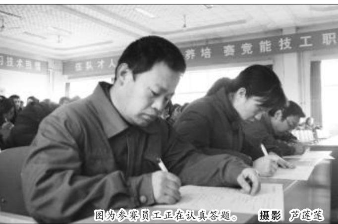
图为参赛员工正在认真答题。

工进一步认清形势、统一思想、坚定信心, 坚决打赢控亏增盈攻坚战, 完成改革创新和结构调整的目标; 同时通过技术比武, 进一步提高全体员工的技术素质和操作技能, 激发广大职工学知识、学技术、钻研业务的热情, 为中铝山西企业又好又快发展提供人才支撑。