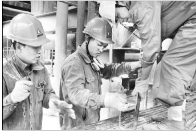
为确保焙烧炉稳产高产运行，从10月19日起，氧化铝四分厂与检修分厂、计控室等相关单位密切配合，对2号焙烧炉进行为期18天的全面系统检修。图为四分厂检修车间员工正在清理检修冷却器管束。

而今，四分厂正采取有力措施，优化氧化铝技术指标，确保焙烧炉稳产高产，严格控制费用支出，全力以赴控亏增盈，努力为中铝山西企业实现10月份降本增盈目标做出更大的贡献。