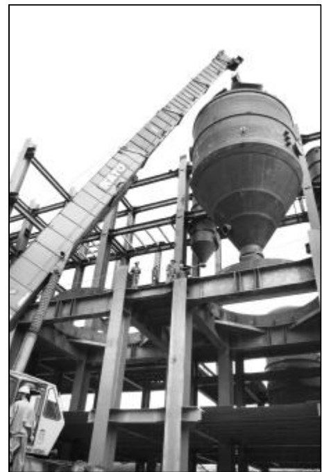
蒸发器更新改造是山西分公司重点更新改造项目,对控亏增盈有着重要意义。8月7日,检修分厂在顺利完成氧化铝蒸发器更新改造的全部制作任务后,迅速进行安装。图为40多吨重的蒸发器液室安装就位。

8月2日清晨,氧化铝二分厂溶出调配液管道出现沉淀、堵塞现象,粗液碳分浓度不断下降,最低达到了10g/l。如果再继续下降,就会出现分离沉降槽、洗涤沉降槽赤泥变性、跑浑的严重情况,进而导致整个流程中断。