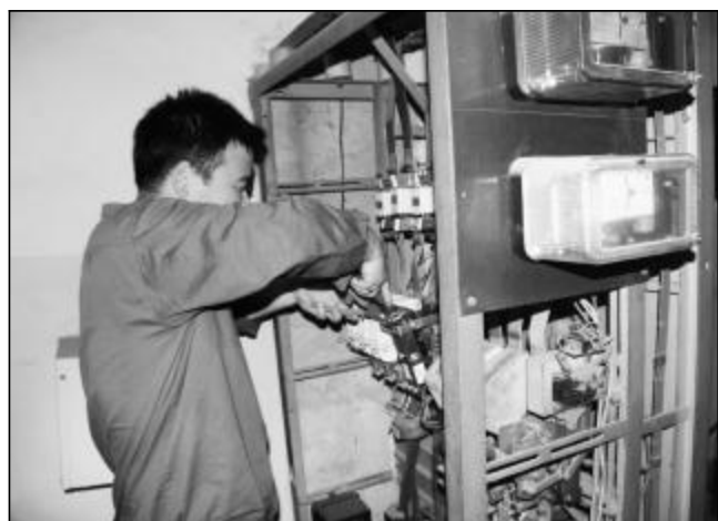
为确保夏季用水高峰正常供水,近日,东兴物业部加大对水源井的日常巡检,对发现问题及时处理,保障了辖区居民生活用水正常供给。图为维修中心电工在更换接触器。

★ 近日,运输部机务段紧紧围绕减低油耗指标,开展操作技能和理论知识竞赛,竞争上岗,在车间掀起学技能高潮。(剑锋 国来)