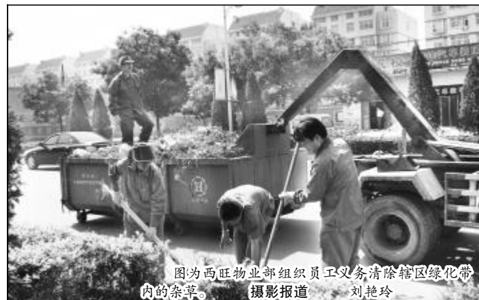
图为西旺物业部组织员工义务清除辖区绿化带内的杂草。

2009年的山西铝厂又迎来新一轮的大发展，西旺这块传统服务业上的耕耘者也和其他铝城人一样孕育着希望，他们正肩负构建和谐社区的重任，沿着改革创新的道路阔步前进。