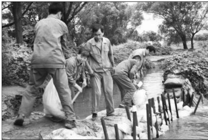
近日,中铝山西企业水源明渠因雨水冲刷造成二余米溃堤,严重威胁到企业生产用水。水电分厂及时组织工效组人员,千方百计克服因连续两天艰苦奋战,修复了堤坝,确保了企业生产生活的正常用水。图为水电分厂工效组人员齐心协力修复堤坝。