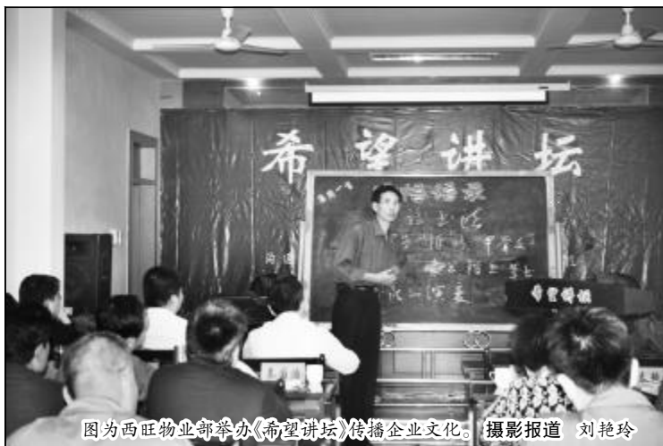
图为西旺物业部举办《希望讲坛》传播企业文化。

与此同时，西旺物业部想职工所想，急职工所急，2007年打通了希望街，缓解了上下班高峰的交通压力；设立朝西服务点，开发