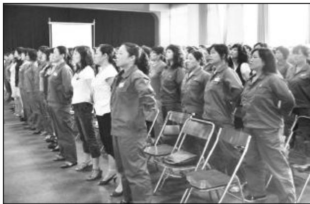
为做好第四届职工文化艺术节演出,近日,煤气分厂拉开艺术节大合唱节目排练的序幕。此次煤气分厂参加艺术节大合唱的两首曲目为《中国朝前走》和《在灿烂阳光下》,演唱人员共220人。分厂高度重视本次大合唱演出,对节目排练提前安排部署,成立活动筹备组、后勤保障组以确保节目排练效果。图为员工精神饱满、热情高涨地进行大合唱曲目排练。摄影报道 金海波

本报讯 为加强部机关与各基层单位的沟通联系,求知于职工,问计于基层,服务于物业,加快促进工作落实。近日,东兴物业部进一步完善机关联系基层工作制度。制度在确定目标任务、联系方式、责任分工和要求的基础上,开通党员服务咨询热线,畅通与基层党员沟通渠道,通过构建党、群互动平台工作制度,充分发挥双联纽带作用,促进和谐社区建设。(原翠草)