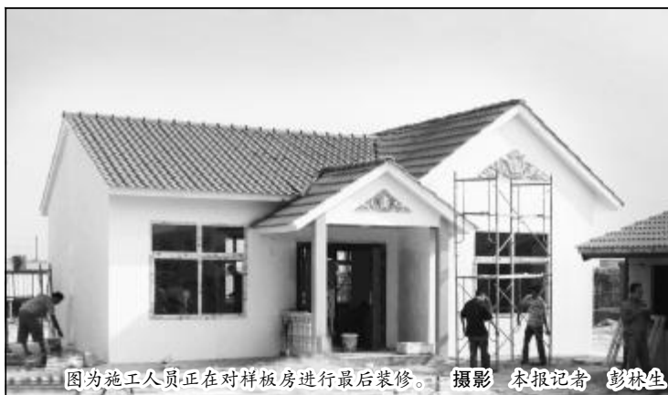
图为施工人员进行最后装修。

时间紧迫,任务繁重。接到任务后,设计院连夜设计,最短时间拿出设计方案;晋铝华丽紧张施工,所有材料采取现场加工,管理人员现场办公,随时解决问题。目前,样板房已完成全部装修,具备了居住条件。