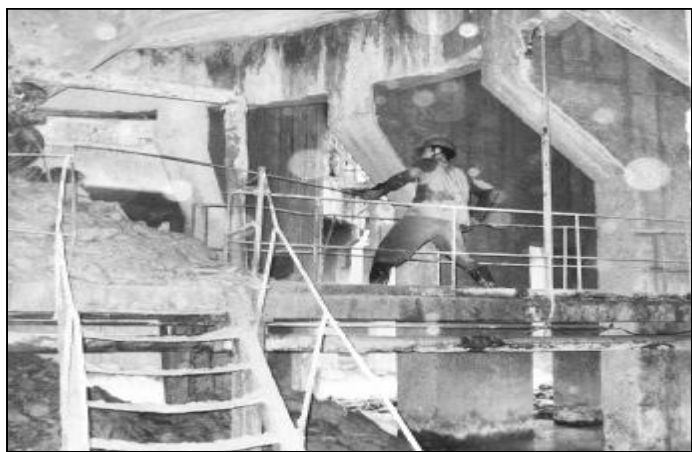
▲ 7月7日,氧化铝二分厂洗漆车间党员进行人工清理沉降槽槽壁和结疤,为顺利实施“213”生产方案奠定基础。

此次检修的主要任务是筒体挖补与砌筑,风机、螺旋、电收尘、排水管等检修任务。开工以来,各施工单位密切配合,不分昼夜的赶进度;参战员工克服高温、高空等困难,创新工作方式方法。经过大家共同努力,劳动效率大幅提高,检修分厂比原计划提前15小时完成检修任务,创造了新的施工记录。(张安泽 寻向民)