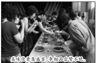
美味佳肴集盛宴,争相品尝赞不绝。

六月,如火如荼的六月。丝毫不影响大家一显身手的激情,市场选材、精料加工、悉心烹饪、拿捏火候、新鲜出炉、裱盘呈上,这一系列的用心都被溶解在这方寸的器皿中。说是日子要精打细算地过,却也要鸡翅、猪手、牛肉、鱼虾等一个不落。男女搭配,干活不累,夫妻档更是潇洒走一回,为大家做好清热解暑的百合冰糖羹,让你热天真不怕;再看看那有着