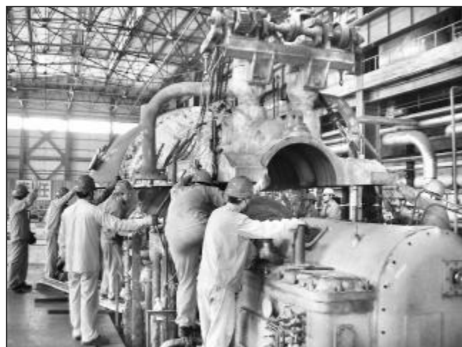
近日，热电厂对8号汽轮发电机组进行大修。这是该机组投入运行以来的首次大修，计划工期为50天。检修车间对技术质量、安全施工以及人员进行合理安排。检修人员眼睛向内，自加压力，主动承担起原属外委的大修任务。图为检修人员正在起吊汽缸。